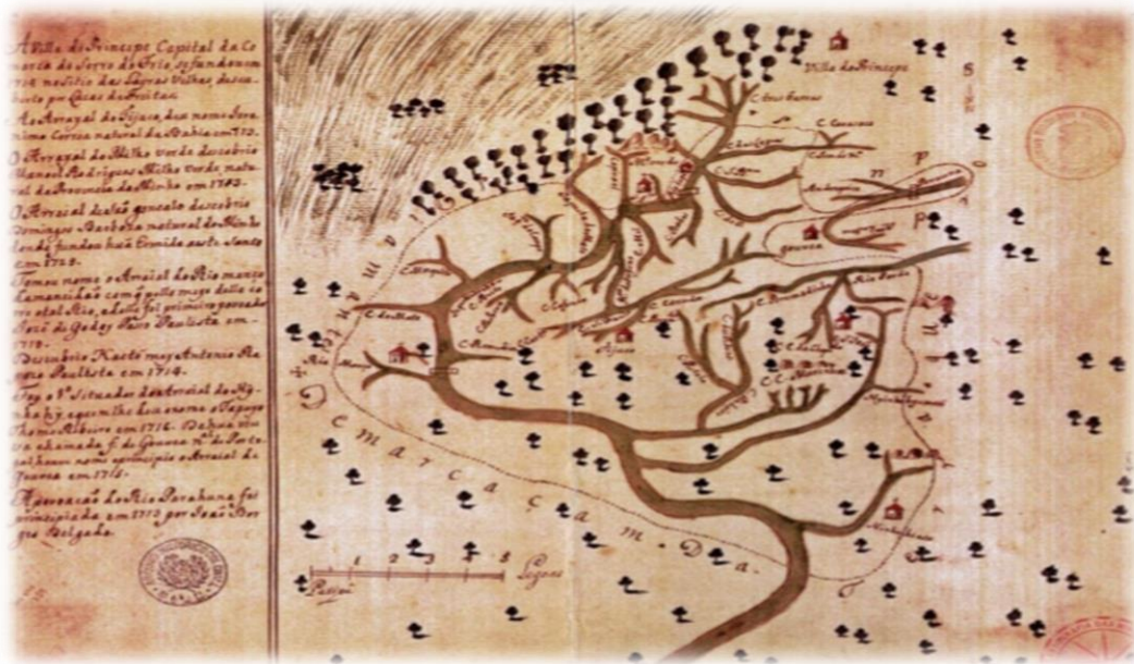
Figura 2- Mapa da demarcação das terras que produzem diamantes.