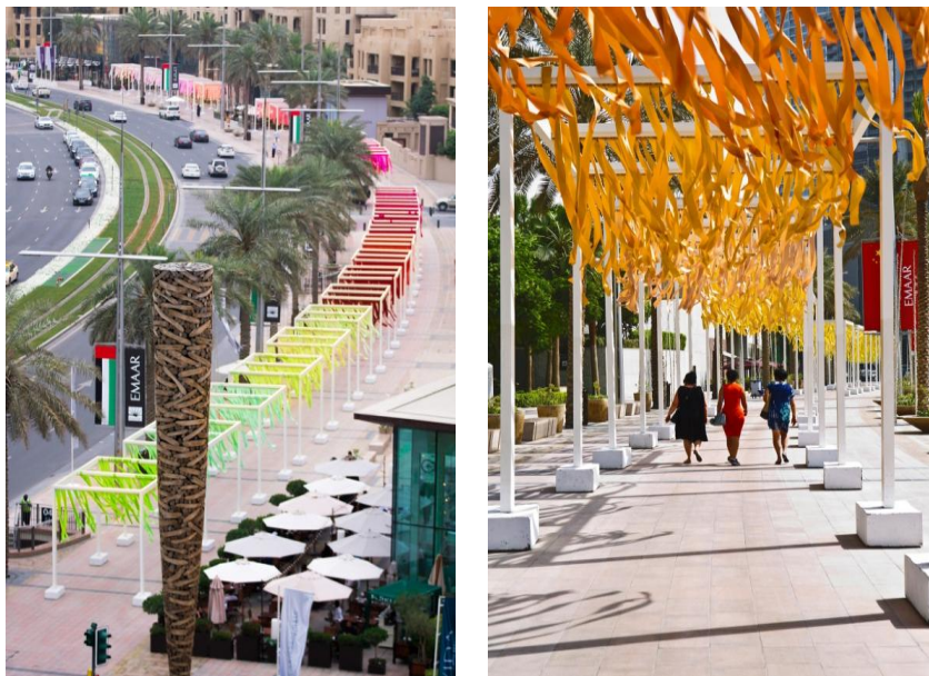
Imagem 1: 100 cores no.23, Downtown Dubai, Fevereiro a outubro de 2018, Dubai do centro (UAE), Fonte: https://www.emmanuellemoureaux.com/profile

O shikiri - "Dividindo e criando espaço através das cores" (Emmanuelle Moureaux). Emmanuelle Moureaux, usa das cores como elementos tridimensionais, como camadas, e assim cria espaços, a artista não usa das cores simplesmente para dar acabamento final, mas sim como a própria composição do trabalho. O termo shikiri é uma palavra inventada, seu significado é dividir o espaço usando cores.