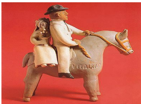
Figura 3 – “Noiva na garupa do cavalo do noivo”. Mestre Vitalino.

A produção artística de Vitalino abordava o cotidiano do seu lugar em sua diversidade de forma genuína: a rotina diária, a labuta do trabalho, as festas, os cultos religiosos, os animais e até mesmo o cangaço eram seus objetos de criação. Para Lélia Frota (2011), a obra de Vitalino pode ser interpretada como um registro estético, cultural e social de três ritos de passagem, a saber, nascimento, casamento e morte. A obra “Noiva na garupa do cavalo do noivo” expressa uma parte do rito do casamento. A noiva sentada na garupa é o desfecho do casório, é o momento em que o casal vai para sua casa. Numa época em que não havia carro, o cavalo servia de transporte para os recém-casados.