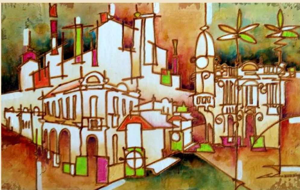
IMAGEM-CITAÇÃO: GUEDES, GERSON. RIO BRANCO COM HALFELD, 80x50CM

"AO UTILIZAR TRAÇOS E CORES SIMPLES, BUSCO TRADUZIR EM MINHAS OBRAS O INTERIOR DE MINAS, SUAS HISTÓRIAS, SUA GENTE E SEU JEITO DE SER, REGISTRANDO ESSA "MINAS" AINDA PECULIAR E ANÁLOGA, SILENCIOSA EM SEUS GROTÕES, ACIRRADA EM SEUS COMÍCIOS, BARULHENTA EM SUAS QUERMESSES. O CHEIRO DO CAFÉ VINDO DOS FOGÕES A LENHA, O CANTAR DOS CARROS DE BOIS, A RELIGIOSIDADE, O CORETO, O LARGO, A BANDA, OS CAMINHOS E ATALHOS QUE DESENHAM SUAS MONTANHAS."