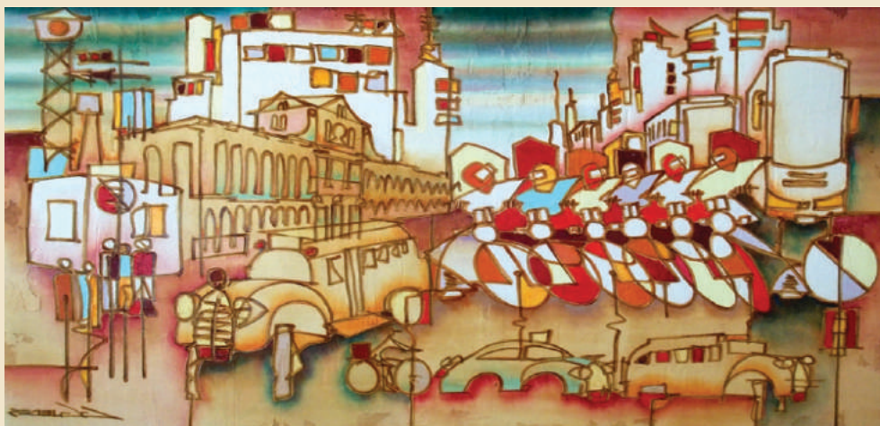
IMAGEM-CITAÇÃO: GUEDES, GERSON. AV. GETÚLIO VARGAS, 120 X 80 CM

O POETA JUIZ-FORANO CONTA TAMBÉM QUE NASCEU “ÀS MARGENS DE UM RIO-AFLUENTE DE ÁGUAS PARDAS, O PARAIBUNA, QUE FAZIA MUITA FORÇA PARA ATINGIR OS PÉS DO PAI PARAÍBA” EM SEU LIVRO AUTOBIOGRÁFICO A IDADE DO SERROTE, DE 1968.