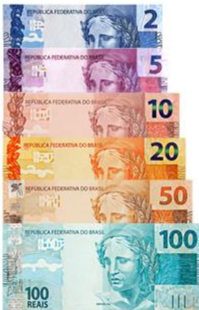
Figura 1 – Cédulas utilizadas atualmente.

Fonte: Site do Banco Central do Brasil 1