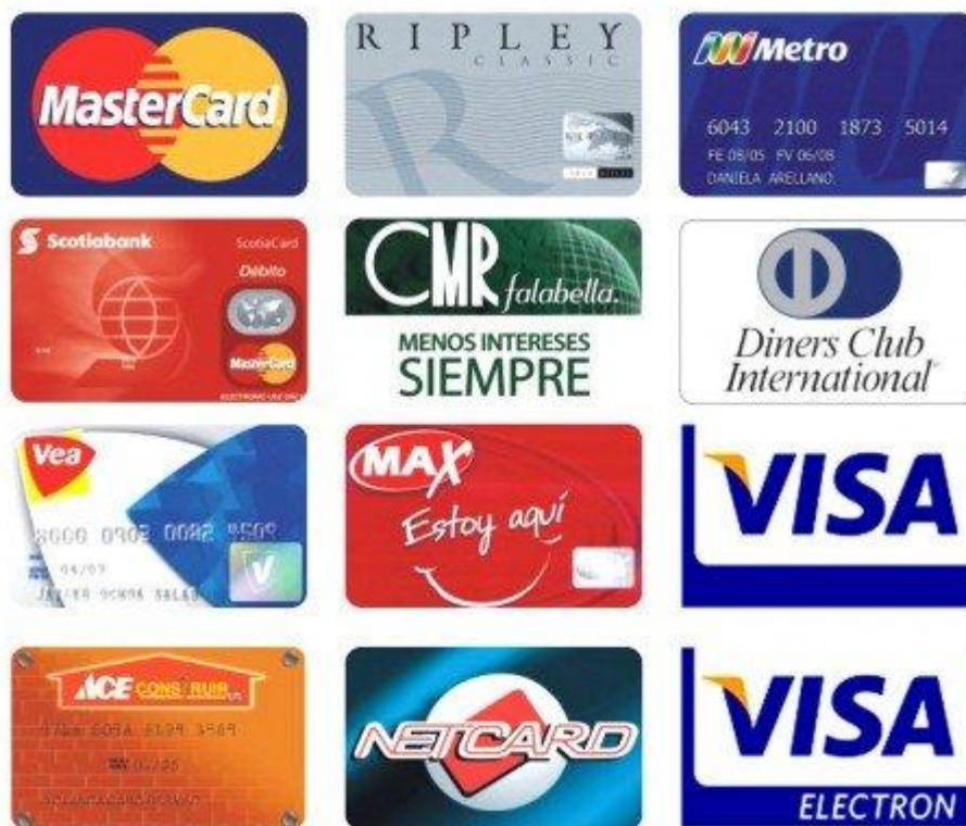
Figura 3 – Figuras de cartões de crédito