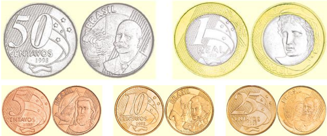
Figura 2 – Moedas utilizadas atualmente.