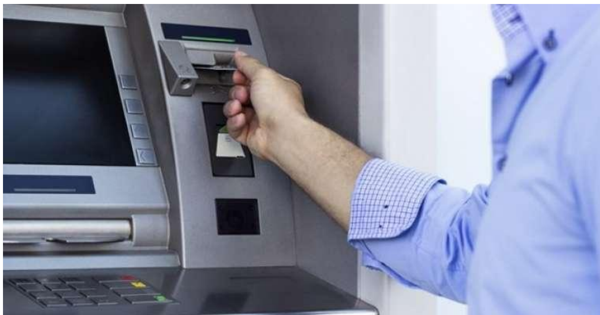
Figura 5 – Figura de um caixa eletrônico.