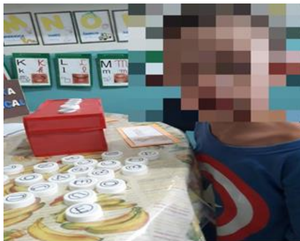
Imagem 2-Caixa de Leitura II