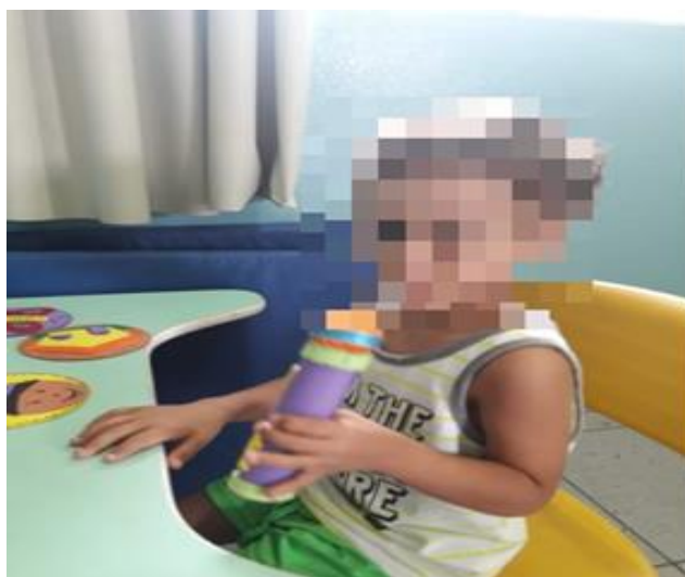
Imagem 4- Criança com autismo brincando com a caixa musical