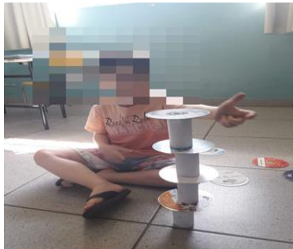
Figura 8- Criança autista usando o recurso para fazer atividade de sequência numérica II