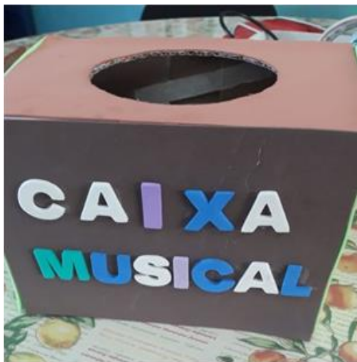
Imagem 3-Caixa Musical I

A caixa de leitura foi elaborada com os seguintes materiais: uma caixa de sapato encapada tampinhas da caixinha de leite (tampa e a base para enroscar), fichas com as palavras que serão reproduzidas no recurso. Os objetivos são trabalhar a acuidade vasomotora, atenção, consciência fonológica e silábica.