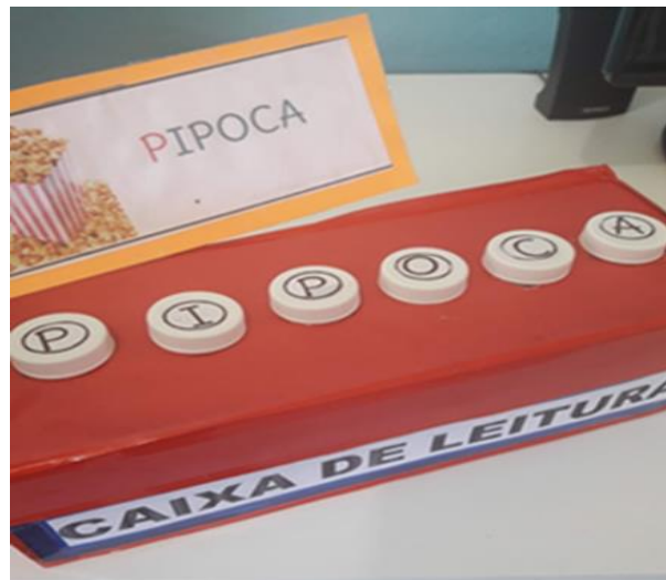
Imagem 1 - Caixa de Leitura I

Abaixo seguem alguns registros das intervenções, realizadas junto aos alunos: