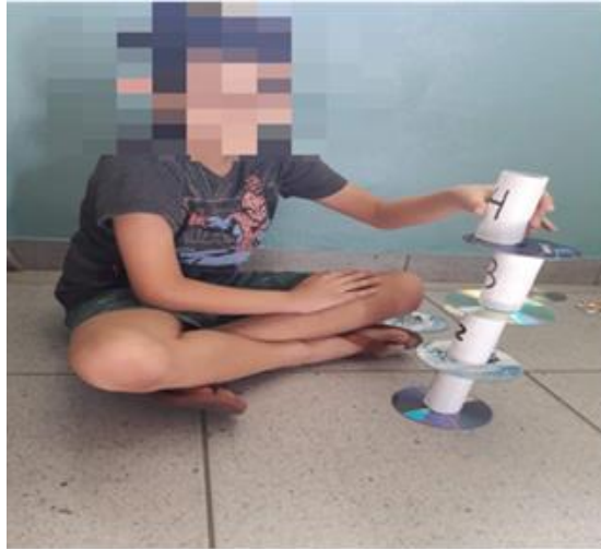
Figura 7- Criança autista usando o recurso para fazer atividade de sequência numérica I