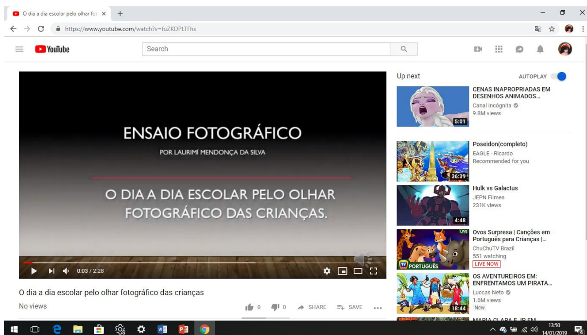
Figura 2 – Postagem no YouTube

https://www.youtube.com/watch?v=fuZKDPLTFhs .