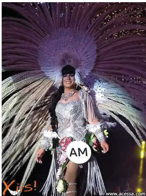
Figura 9 – Miss Amazonas desfilando com o traje criado por Marcelo Dias (2018)

vestido cravejado de brilhantes, acessórios de penas com grafismos indígenas e vitórias-régias saindo das partes íntimas da miss – recorrendo a um simbolismo de feminilidade ligado aos órgãos genitais considerados femininos, como a vulva e a vagina –, complementados pelo cabelo preto e trançado (diferente de muitas misses, que usam seus cabelos presos em coques ou com permanentes), a Miss Amazonas se transformou na imagem da lenda indígena brasileira sobre a sereia Iara.