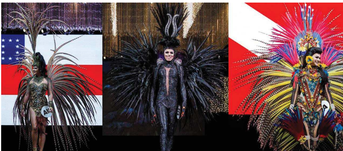
Figura 2 – As misses Amazonas, Espírito Santo e Pará no desfile de traje típico (2017)