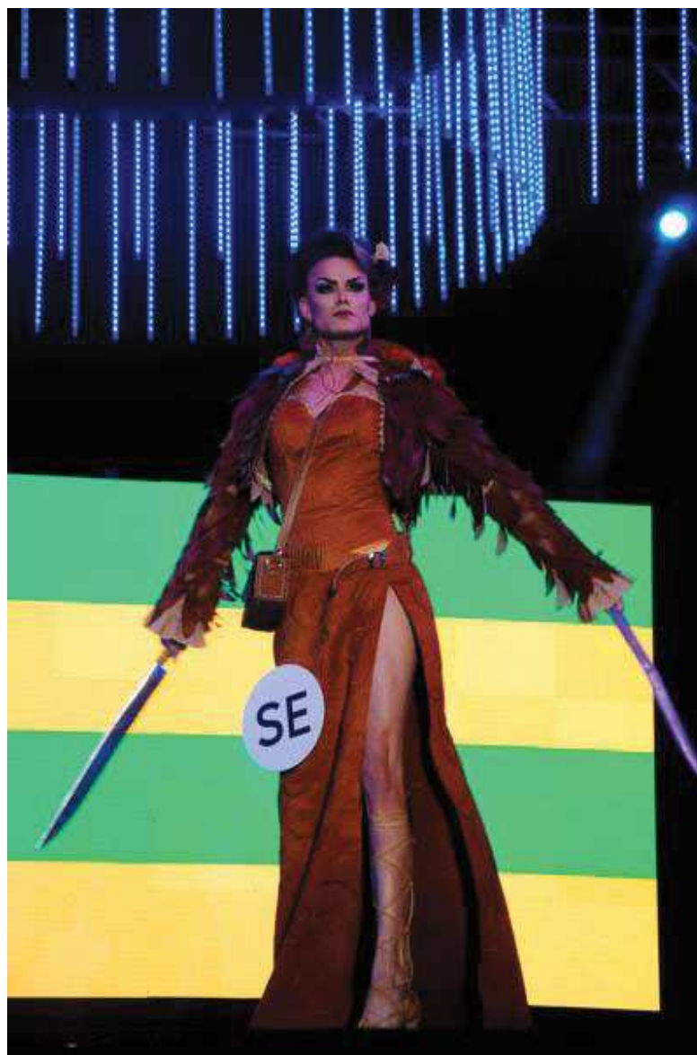
Figura 6 – Miss Sergipe homenageando as mulheres sergipanas (2018)