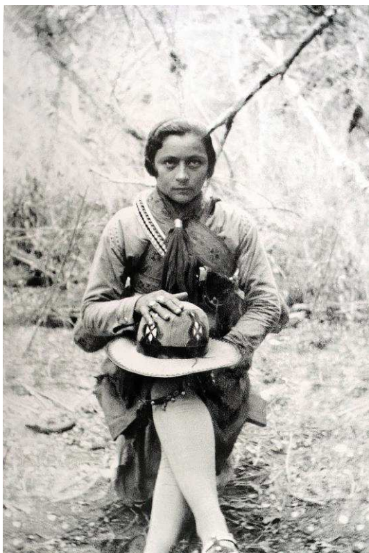
Figura 7– Maria Bonita, que, apesar de baiana, foi um ícone do cangaço sergipano.