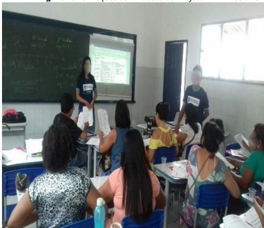
Figura 1: Formações continuadas do Projeto IDEB Positivo