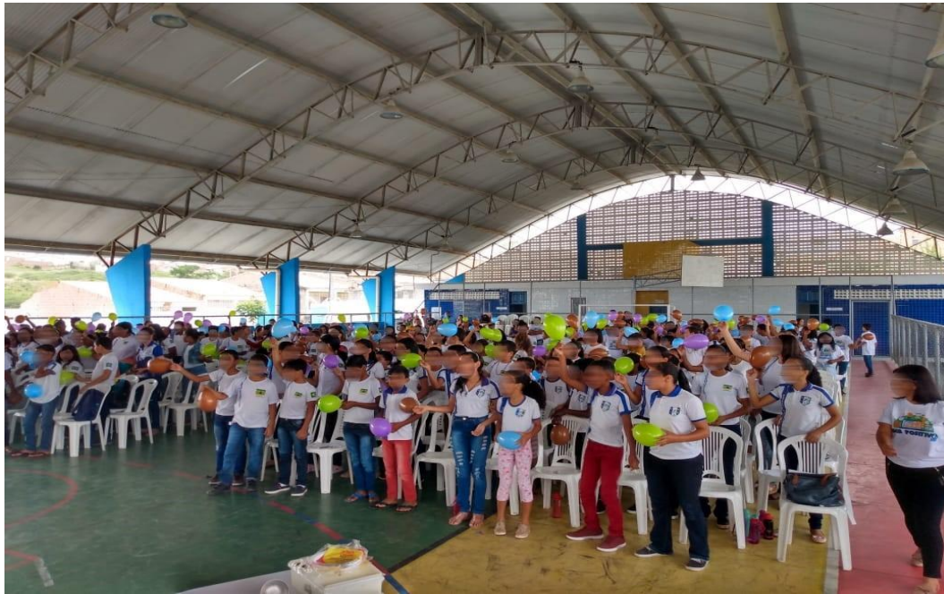
Figura 6- Culminância do circuito preparatório das avaliações SAEB, aulão motivacional IDEB Positivo