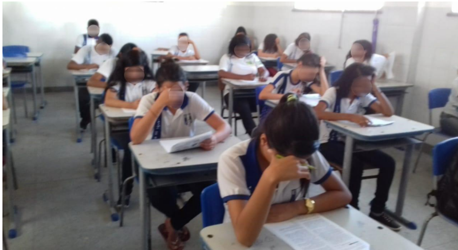
Figura 4- Aplicação do Simulado Prova Brasil do Projeto IDEB Positivo