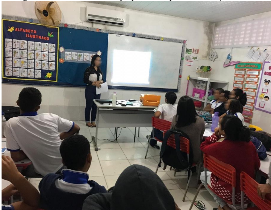
Figura 5- Circuito das aulas preparatórias para as avaliações SAEB