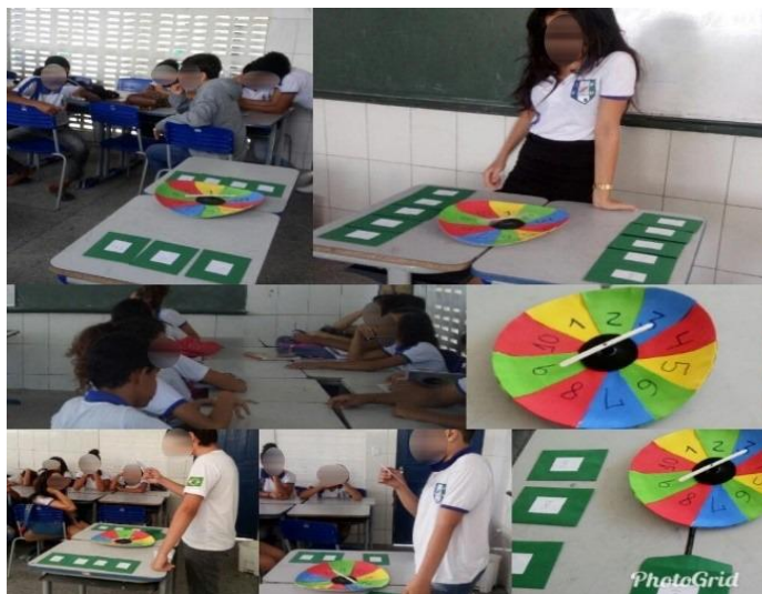
Figura 3 - Material didático do aluno e aplicação de metodologias ativa do Projeto IDEB Positivo