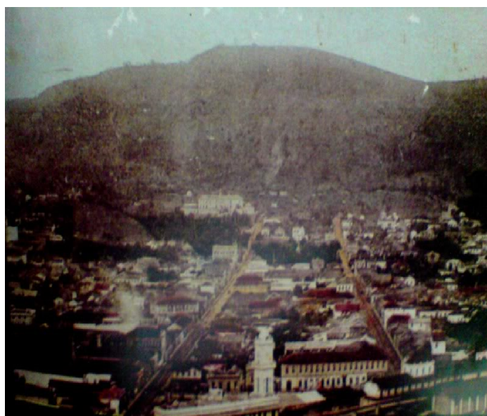
Figura 2 - Fotografia da vista panorâmica do distrito da cidade de Juiz de Fora, em 1900, tirada do Mirante do São Bernardo (AMARAL, 2013, paginação irregular) 47 .

Naquela época, não era possível encontrar construções tão altas como as que predominam no centro urbano de hoje. As torres das igrejas e da estação ferroviária deviam ainda cumprir sua função, sendo marcos de referência espacial e temporal, com seu relógio e o badalar dos sinos.