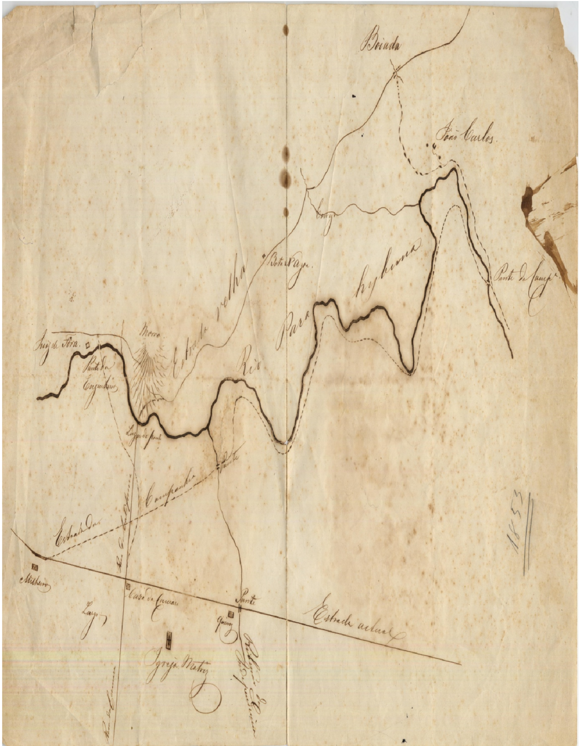
ANEXO 1 – Fotografia do desenho da cidade de Juiz de Fora, de Henrique Halfeld (1853).