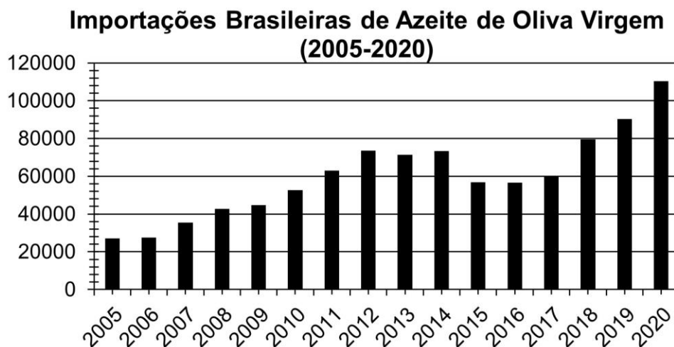
Gráfico 1 – Importações brasileiras de azeite de oliva virgem (2005 a 2020).