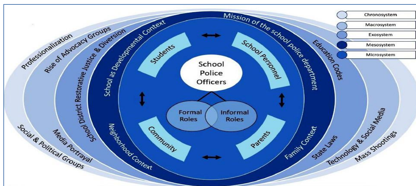
Figura 3: Modelo bioecológico dos papéis dos oficiais de policiamento escolar e dos contextos que modelam esses papéis (GRAHAM et al., 2021, p.4)

Em uma das lives que assistimos do PROERD em 2021, o policial afirmou que em muitos casos precisa fazer “atendimento psicológico”. Durante a pandemia, as dificuldades e a necessidade