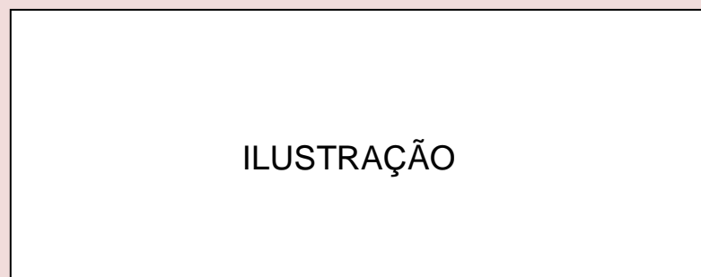
Organograma 1 - Serviço de atendimento da Biblioteca Central da Universidade Federal de Juiz de Fora