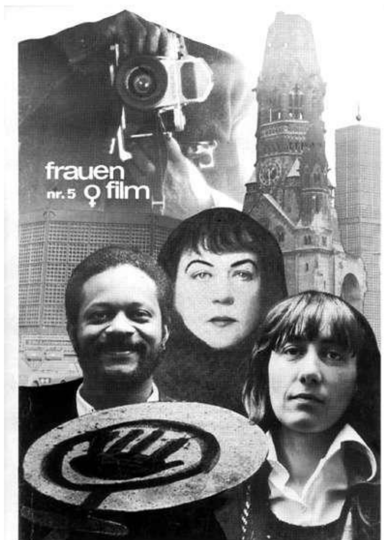
Figura 13 – Capa da edição de número 5.

Sarah Schumann foi uma pintora nascida em 1933 em Berlim e ambos seus pais eram escultores. Aos 16 anos saiu de casa e aos 19 se concentrou na pintura. Depois de participar de várias exposições, nos anos 1960 morou por alguns anos na Inglaterra, Itália e retornou para Berlim Ocidental em 1968.