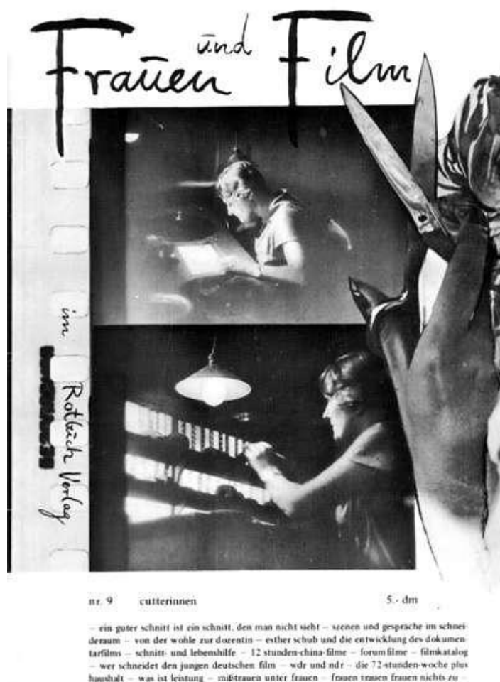
Figura 15 – Capa da edição de número 9.