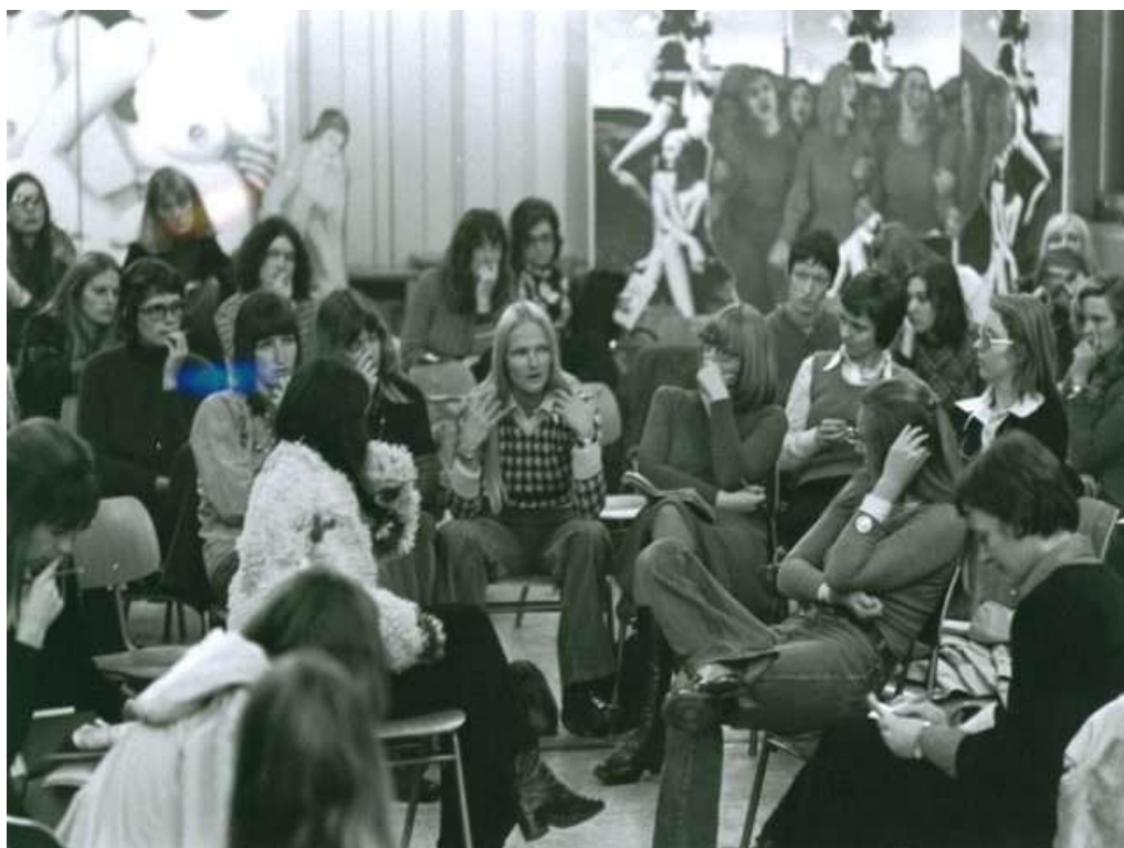
Figura 7 – Durante o Primeiro Seminário Internacional de Filmes de Mulheres. Berlim Ocidental, novembro de 1973.