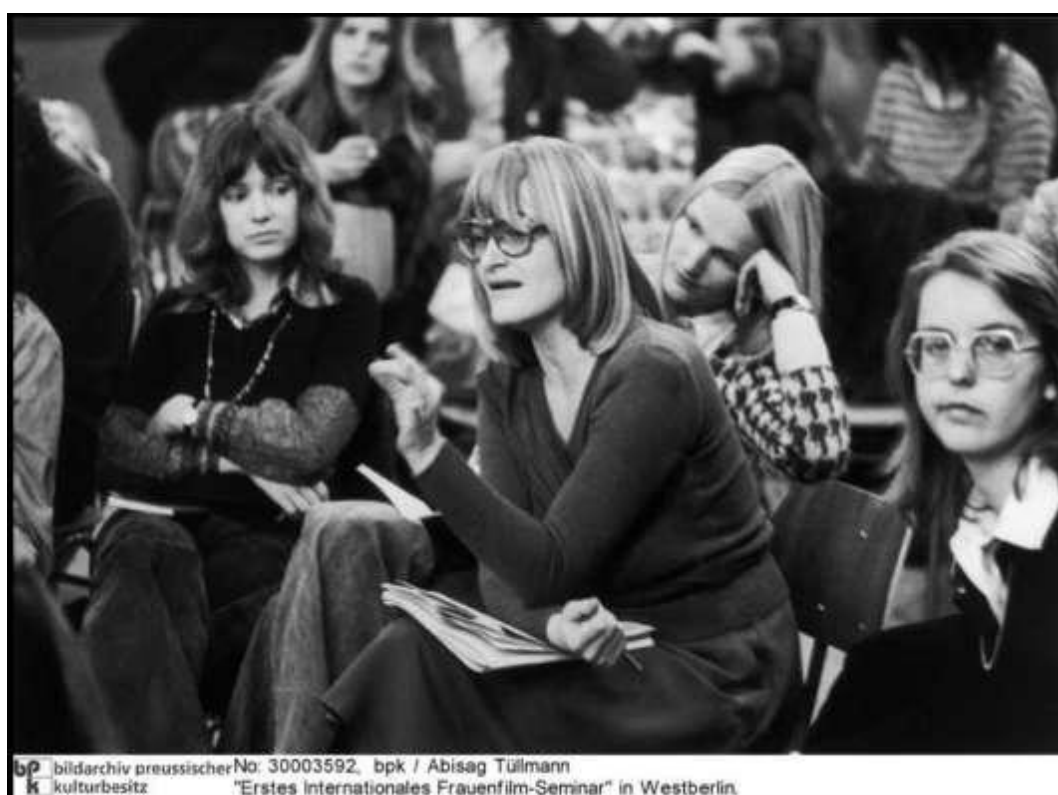
Figura 8 – Alice Schwarzer, jornalista e conhecida feminista da Alemanha durante o Primeiro Seminário Internacional de Filmes de Mulheres. Berlim Ocidental, novembro de 1973.