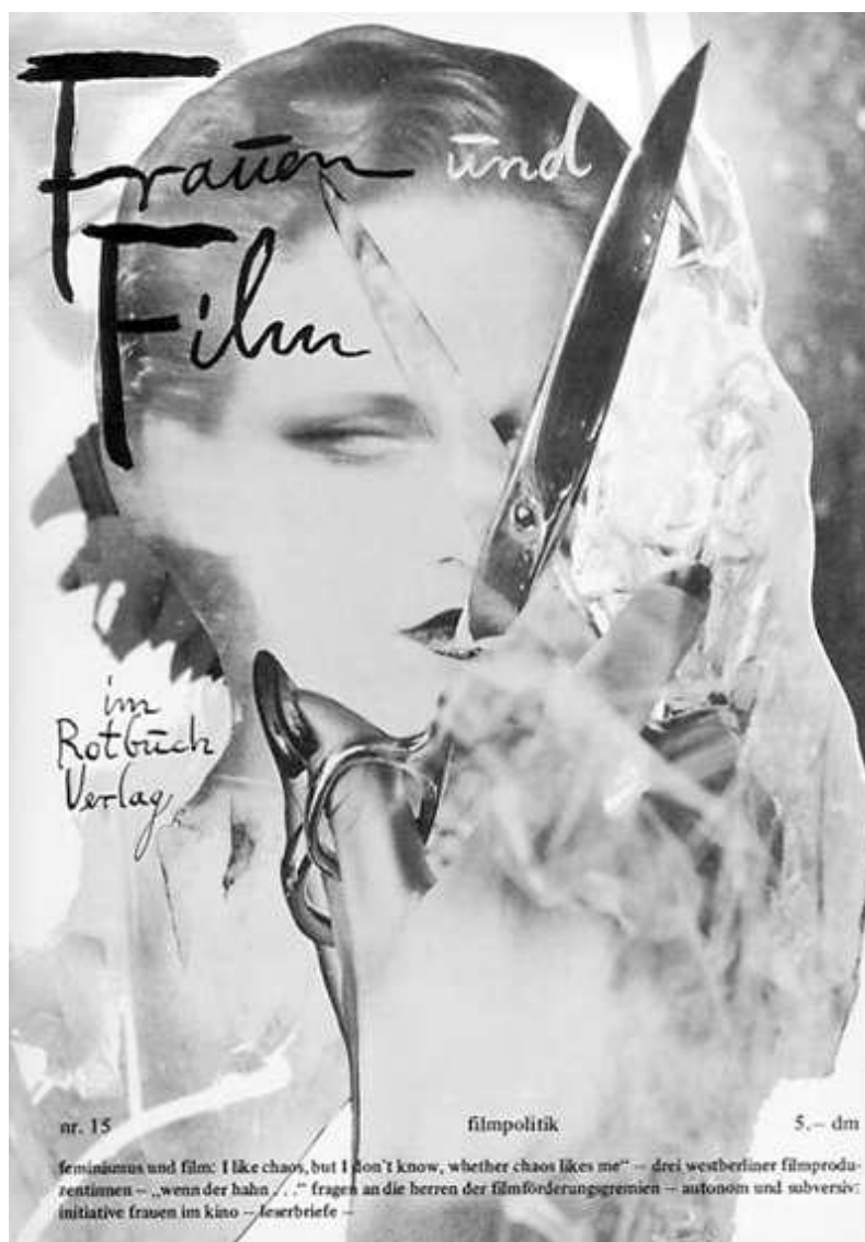
Figura 16 – Capa da edição de número 15.