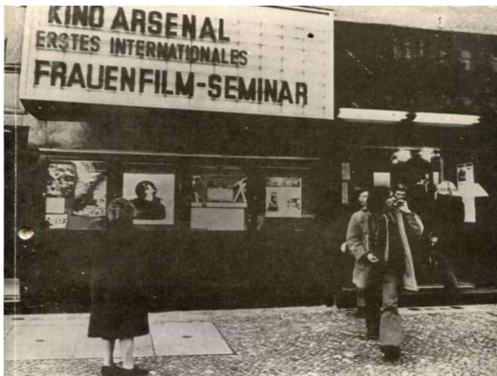
Figura 5 - Fachada do cinema de rua 'Arsenal' em Berlim Ocidental exibindo o anúncio do seminário.