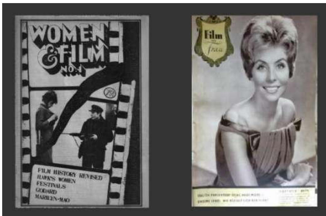
Figura 18 – Na esquerda a capa da revista estadunidense “Womenandfilm” e na direita da imagem, uma capa da revista alemã “FilmundFrau”.

No editorial de número 3, aspectos importantes sobre a abordagem da revista Frauen und Film são discutidos. Sendo um deles a dificuldade de encontrar fotos dos filmes feitos por mulheres e o outro, a possibilidade de artigos de homens serem publicados na revista.