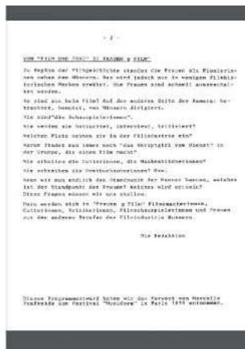
Figura 9 - Capa da primeira edição da revista Frauen und Film e na direita, o editorial.