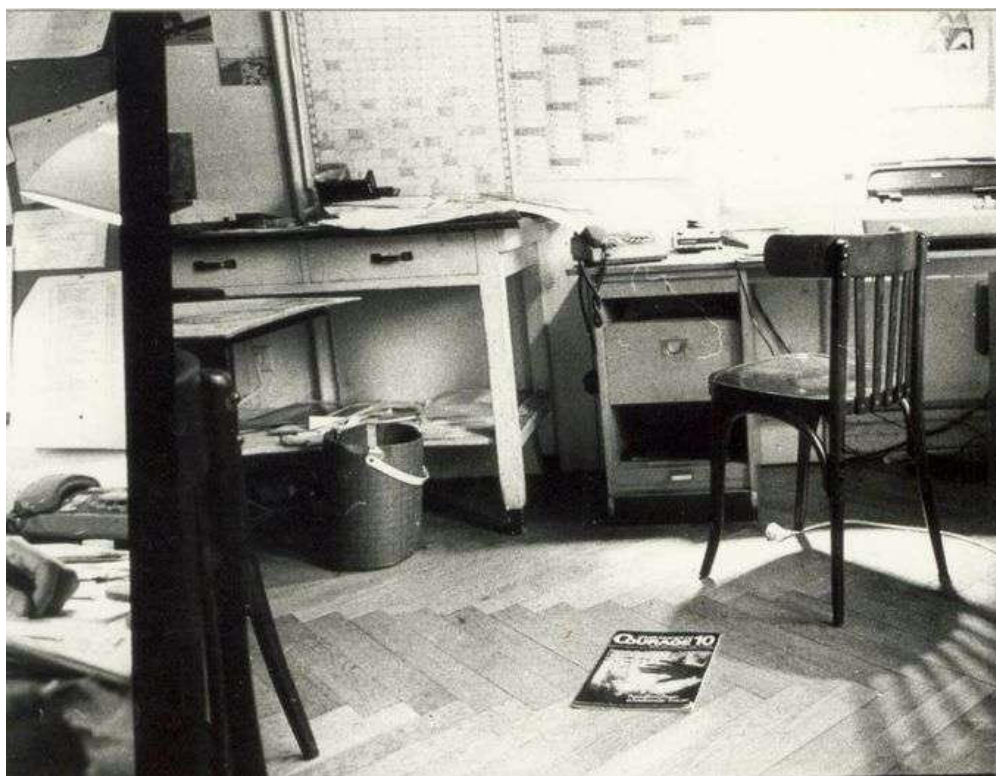
Figura 3 - “Sala de escritório com móveis de escritório antigos, máquina de escrever, telefone e material de escritório”. (MEHL, 2011 s/p).