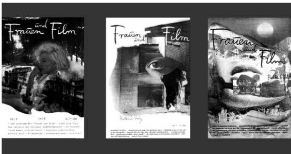
Figura 11 - Capas das edições de número 6, 7 e 8. Destaque para o “im Rotbuch Verlag” a partir do número 7, mostrando que a publicação mudou de editora.

Jansen 119 . No número 6 é informado que a revista será lançada aproximadamente seis vezes ao ano.