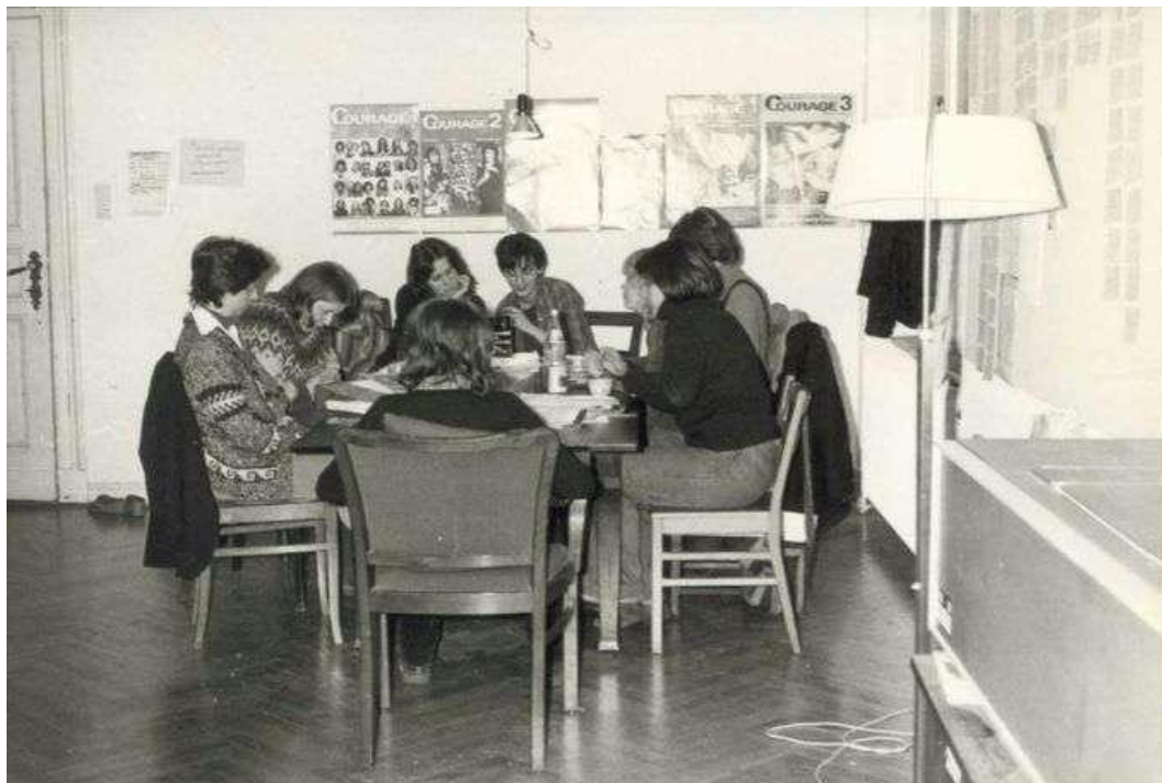
Figura 2 - “As funcionárias se sentam em uma mesa na redação durante uma reunião” (MEHL, 2011 s/p)