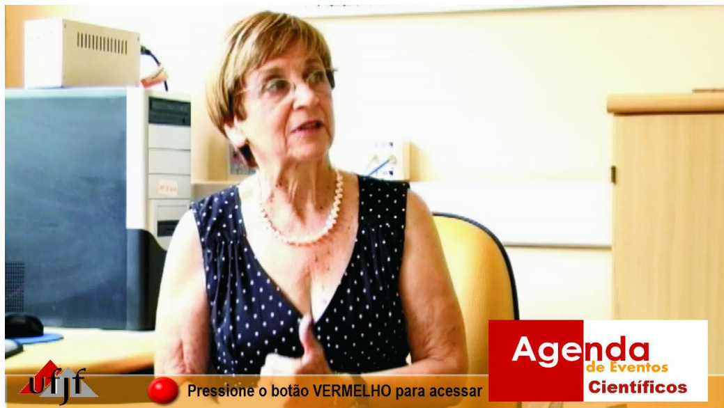
Figura 6 - Link de acesso ao aplicativo de agenda eletrônica.

O quarto aplicativo interativo que aparece no programa é uma agenda eletrônica, como pode ser visto no link de acesso ilustrado na Figura 6.