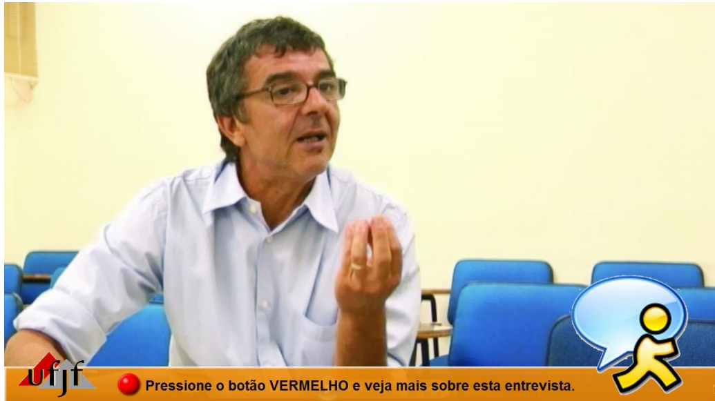
Figura 5 - Interface de acesso a vídeo anexo.

Os links para os vídeos anexos do programa anterior não vinham com a informação indicando como acessar; apenas aparecia o botão e uma informação sobre o conteúdo a ser acessado. Para quem se depara pela primeira vez com esta tecnologia, pode ser difícil entender o que se deve fazer diante dessa possibilidade. Por isso, neste programa, optou-se por já indicar, junto à imagem do botão vermelho, como o usuário deve se portar. Outra observação é que, neste programa, os vídeos anexos têm um botão de “saída”, para o usuário retornar ao vídeo principal, caso queira. Este é mais um diferencial em relação ao programa anterior, uma vez que quando o usuário acessava os vídeos anexos tinha de aguardar a finalização destes para retornar ao roteiro linear. Durante o programa, ainda há mais duas opções de vídeos anexos. Um é sobre o Cineduca, uma atividade do projeto que apenas é citada em um momento do vídeo principal, e, por isso, abrimos este espaço para quem quiser entender esta dinâmica. O outro vídeo é sobre “Letramento Digital”, que é uma das bases desta pesquisa e que também não é abordado no vídeo principal, devido ao curto tempo. Neste último vídeo anexo, é interessante ressaltar que no seu link de acesso aparece o vídeo em miniatura, sem áudio, que é ampliado ocupando a tela inteira, se o usuário acessá-lo.