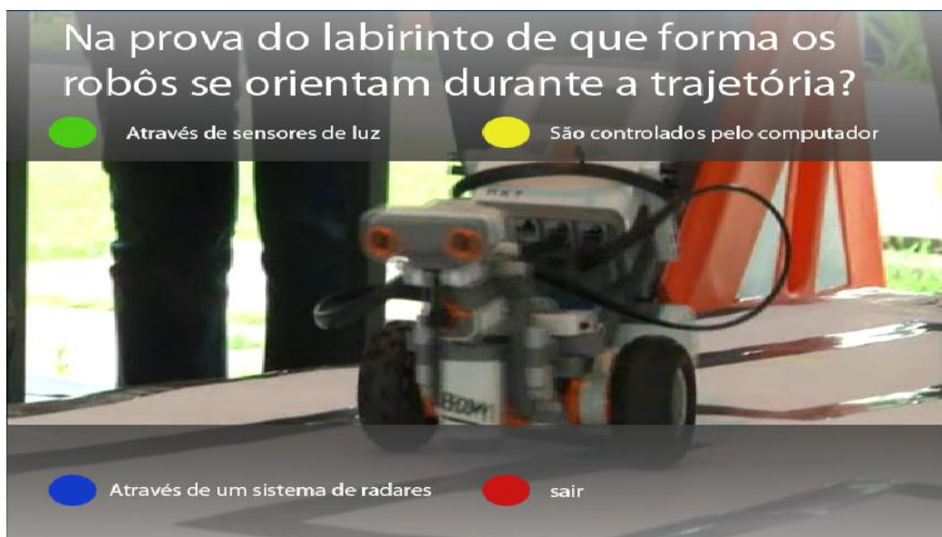
Figura 4 - Quiz aplicado durante o programa-piloto.

No caso específico deste trabalho, o aplicativo de quiz teve como objetivo trazer ao usuário informações adicionais e complementares. As respostas dos quizzes não estavam diluídas ao longo do programa. Não bastava apenas prestar atenção e decorar informações, as perguntas foram elaboradas para fazer o usuário responder, usando, para isso, o raciocínio lógico. Não que as perguntas fossem bastante óbvias, pois não eram. Por exemplo, a primeira questão, que está dentro do vídeo anexo sobre o Kit Lego, traz curiosidades sobre a programação dos robôs construídos com base no Kit . A pergunta é a seguinte: “Qual destes sensores o Kit Lego Mindstorms não possui?” Por meio da resposta, o usuário aprende algumas funcionalidades dos robôs. Outro quiz aparece durante um clip de imagens que evidencia a prova do Labirinto 45 : “Na prova do Labirinto, de que forma os robôs se orientam durante a trajetória?” Com a resposta, o usuário recebe mais uma informação adicional sobre os sensores que facilitam a missão do robô de percorrer o trajeto.