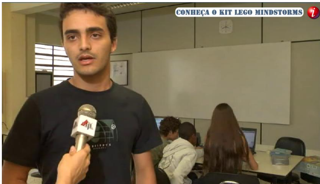
Figura 3 - No canto superior da tela, link de acesso para vídeo anexo.

Para exibir a possibilidade de acesso aos vídeos anexos, apenas foi inserido na tela, no canto direito superior, um botão na cor vermelha com a letra “i” no centro, simbolizando a interatividade disponível, conforme a figura 3.