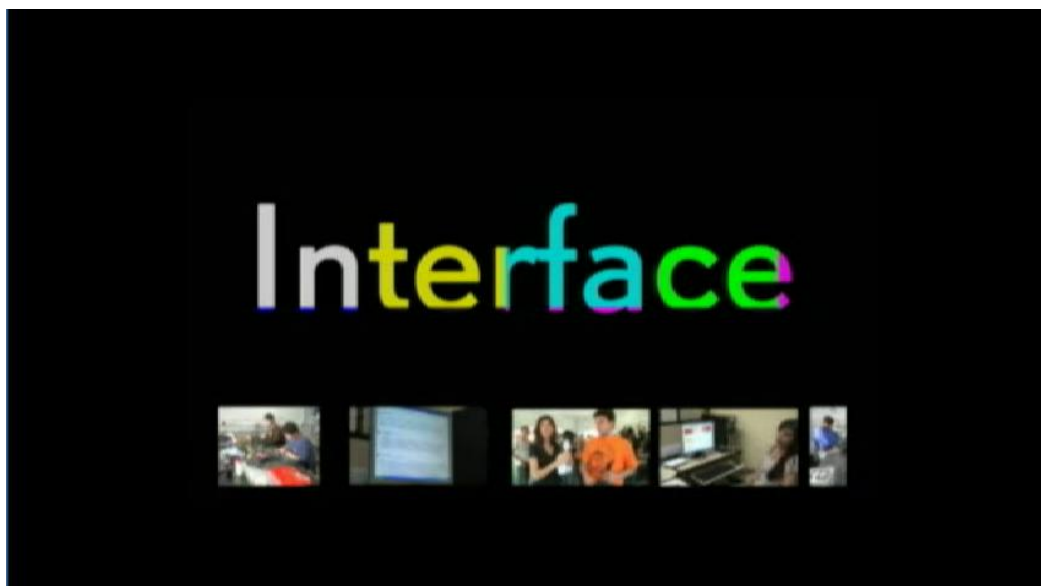
Figura 2 - Vinheta de abertura dos programas-piloto.

Junto com os estudantes da disciplina de “Hipermissão”, foi escolhido um nome para essa série de programas científicos interativos que estava prestes a se tornar realidade – simulada, mas concreta. O nome da série ficou sendo “Interface”, uma sugestão dos estudantes de Comunicação Social, por lembrar a importância da interatividade máquina-usuário. O nome também remete ao vídeo interativo como uma interface do saber universitário, que, por meio da linguagem acessível e dos aplicativos oferecidos pela TVD, traduz e desvenda à população leiga e até mesmo à comunidade acadêmica a linguagem rebuscada e especializada das pesquisas e dos projetos da universidade. “Interface” seria o meio que propiciaria a difusão da transferência de tecnologia do campus universitário à sociedade, favorecendo o contato bidirecional entre ambos. A seguir, tem-se um frame da vinheta de abertura dos programas-piloto (Figura 2).