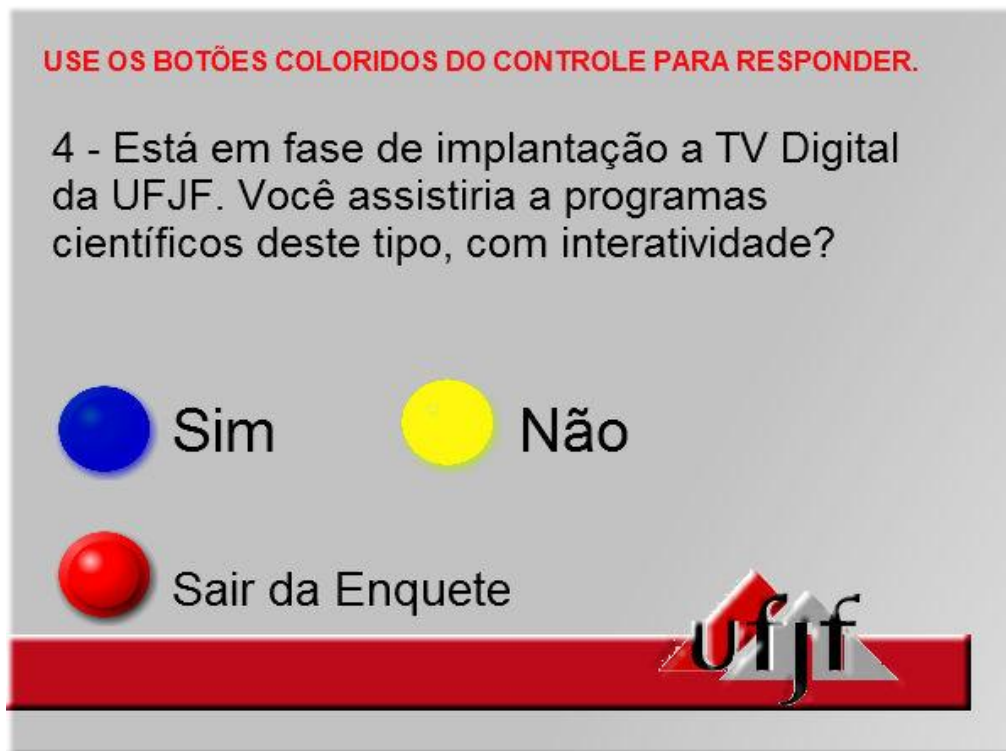
Figura 10 - Enquete aplicada durante o programa-piloto.

Mais no final do programa-piloto, o usuário tem a oportunidade de acessar uma galeria de vídeos dessa série científica. O link de acesso também aparece por 10 segundos e leva o usuário a uma galeria que contém opções de vídeos interativos relacionados à série “Interface”, com sinopses disponíveis sobre os programas. E para encerrar esse programa-piloto, durante os créditos finais o usuário ainda tem a chance de interagir e dar sua opinião sobre o conteúdo e a interatividade do programa. Esta é a enquete eletrônica. No programa anterior foram aplicados questionários físicos aos estudantes, que tiveram acesso ao programa interativo, no intuito de ter o feedback sobre o material. Neste programa, o processo foi facilitado, inserindo o questionário em forma de enquete no final do vídeo. São cinco perguntas semelhantes às do primeiro questionário aplicado no programa de “Popularização da Ciência e da Tecnologia”. No caso do emulador, as respostas da enquete ficam arquivadas na máquina virtual. Veja na Figura 10 uma das interfaces da enquete.