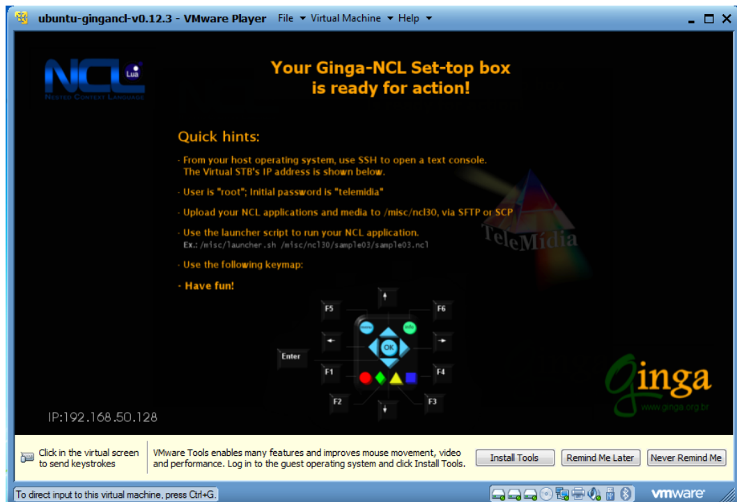
Figura 1 - Tela inicial do VMWARE Player , máquina virtual emuladora da TVD.

Observe que a tela inicial mostra o layout de uma parte de um controle remoto, que se assemelha aos controles das TVs por assinatura, com botões coloridos. Estes serão os botões da interatividade na TVD real. Como esse emulador se passa no computador, o controle também foi simulado por meio do teclado. Note que cada botão do controle corresponde a uma tecla. Nos vídeos interativos produzidos durante a pesquisa foram usados os botões nas cores vermelho, verde, amarelo e azul, ou seja, as teclas “F1”, “F2”, “F3” e “F4” e as setas, correspondentes também às setas do teclado.