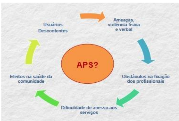
Figura 2 – Ciclo das relações estabelecidas na APS

Tendo em vista que o vínculo é uma ferramenta essencial e que permeia os demais atributos (longitudinalidade, integralidade e coordenação do cuidado), compreende-se que todo o escopo da ESF pode ser comprometido, de modo que a educação em saúde pode não ser estabelecida e informações sejam negligenciadas. Alguns autores trazem, inclusive, a ideia de que o vínculo permite que a saúde migre ao sujeito e que este assuma uma posição, não de inferioridade, mas de centralidade no cuidado em saúde (Barbosa; Bosi, 2017; Bernardes; Pelliccioli; Marques, 2013). A Figura 2, a seguir, resume, de modo esquematizado, o ciclo que é desenhado e se perpetua nas relações descritas nesta pesquisa, nesse território.