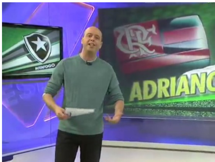
Figura 10 – abertura GE RJ 23/08/12

O programa de sexta-feira, 24 de agosto de 2012, teve 15'09" divididos em três blocos de 7'04", 3'24" e 4'39". Foram exibidos sete VTs: Vasco (2'25"), Megarrampinha (1'38"), no primeiro bloco; Botafogo (1'10"), Flamengo (1'49"), chamada do programa Corujão do Esporte (0'19") no segundo bloco e no terceiro, VT sobre as dores de Fred (2'18"). Há ainda um stand up de 0'54" sobre a Taça das Favelas; uma arte com os convocados para a seleção (0'32"), uma nota coberta de 0'30" sobre a Natação; duas notas secas, uma sobre a morte do ex-goleiro Félix (0'06") e outra anunciando a matéria sobre a frustração do Fred (0'06"). Duas passagens de bloco, ambas usando sonoras de matérias que seriam exibidas: a primeira com 0'38" e a segunda com 0'11". Além de um clipe de 0'13" com imagens da edição no encerramento.