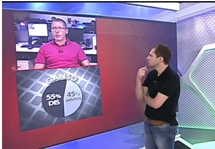
Fig. 1 – vivo explica “Caso Ganso”, GE SP 22/08/12