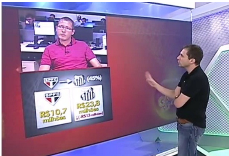
Fig. 3 – vivo explica “Caso Ganso”, GE SP 22/08/12