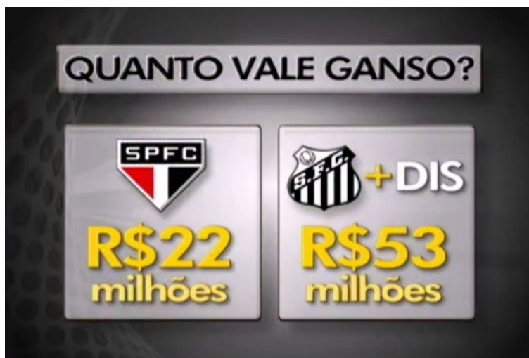
Fig. 5 – arte explica “Caso Ganso”, GE SP 22/08/12