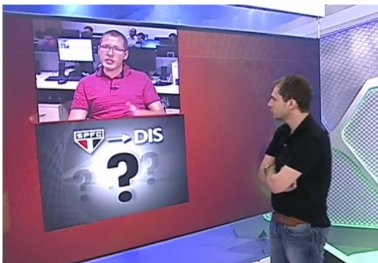
Fig. 4 – vivo explica “Caso Ganso”, GE SP 22/08/12

TIAGO LEIFERT: Então a gente tem essa situação. Então, pro São Paulo, que é a próxima tela (entra tela Quanto Vale Ganso?), o Ganso vale 22, 23 milhões de reais. Pro Santos e pra a DIS, 53 milhões. É uma diferença grande. São Paulo está disposto a negociar até onde, Alê? Quanto mais o São Paulo pode aumentar isso aí, você acha?