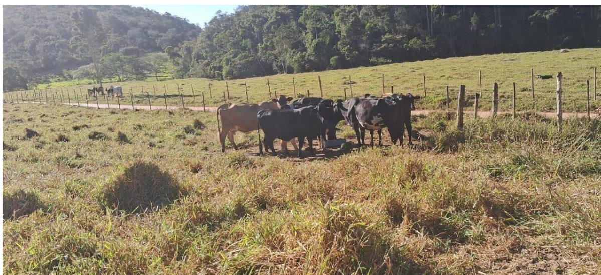
Figura 4 – Criação de gado Assentamento Santa Rosa em MG - 2024

Assim, a pecuária bovina no Assentamento Santa Rosa não deve ser vista apenas como atividade produtiva, mas como parte de um processo maior de luta, permanência e reconstrução da vida no campo. Assim, uma das atividades produtivas de maior relevância nesse assentamento é a produção de leite destinada a laticínios, que se consolidou como importante estratégia de geração de renda e fortalecimento da agricultura familiar.