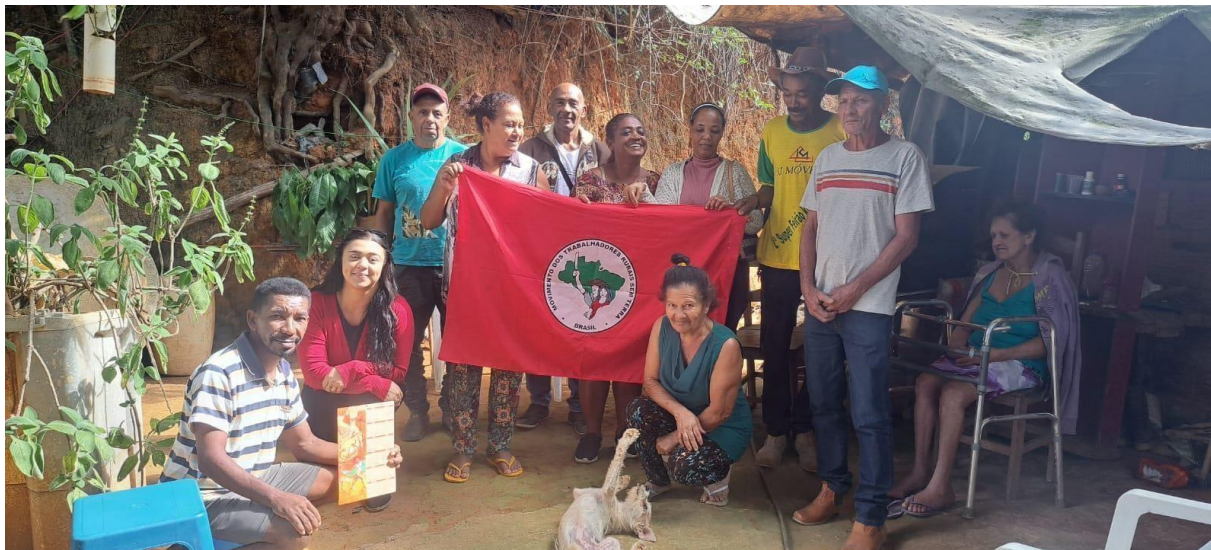
Figura 3 – Assentados moradores do Assentamento Mãe Esperança – MG em 2024