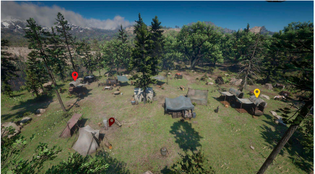
Figura 5 - Primeiro acampamento da Gangue Van der Linde , localizado em New Hanover.