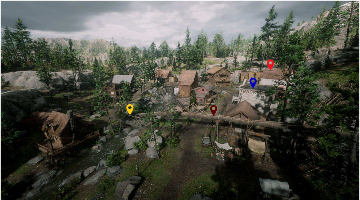
Figura 4 - Paisagem de Strawberry .

em que a natureza é domesticada e reconfigurada segundo parâmetros sociais, políticos e econômicos. Essa perspectiva reforça a ideia de que a paisagem não é apenas o que se vê, mas também o resultado de práticas históricas e técnicas que a moldam.