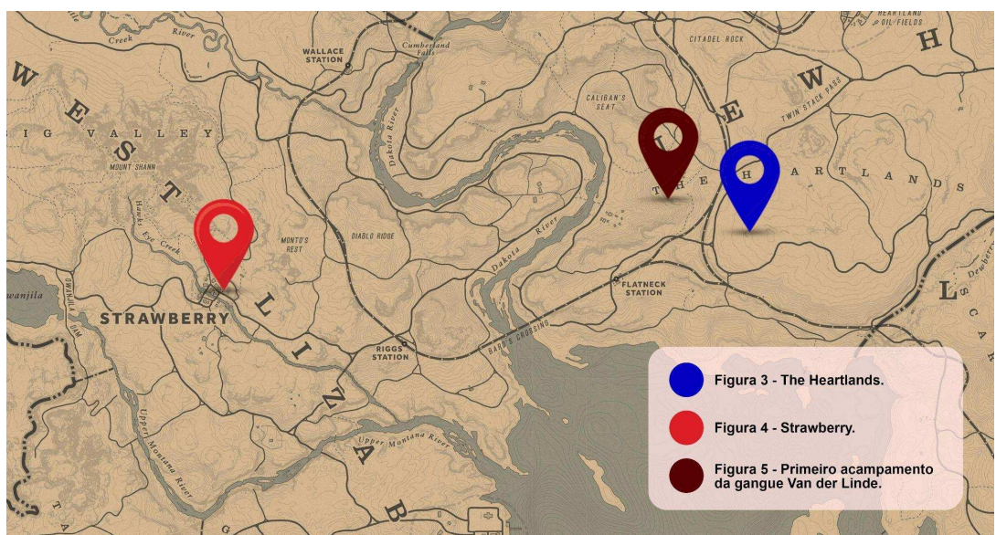
Figura 2 - Mapa da região de Strawberry e The Heartlands ampliado.