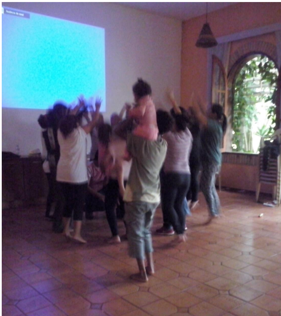
Figura 6 - Recreação para as internas (participação facultativa) 88 .