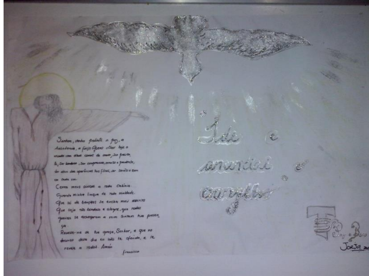
Figura 3 – Fotografia de cartaz feito por residente em Guaratinguetá 84 .