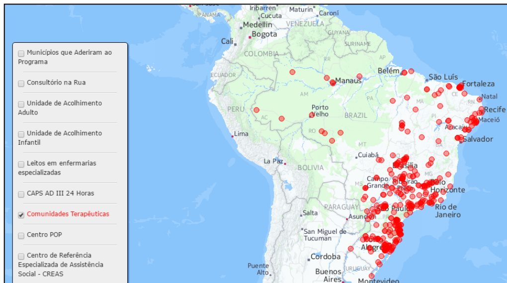
Figura 1 - Distribuição da Rede Nacional de Comunidades Terapêuticas