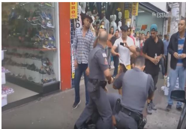
Imagem 8 – imagem mostrando o momento em que a vítima se aproxima do policial