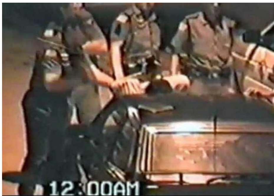
Imagem 2 – imagem extraída do vídeo com policiais agredindo a vítima