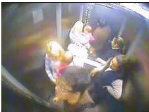
Imagem 3 – imagem extraída do vídeo do circuito do elevador