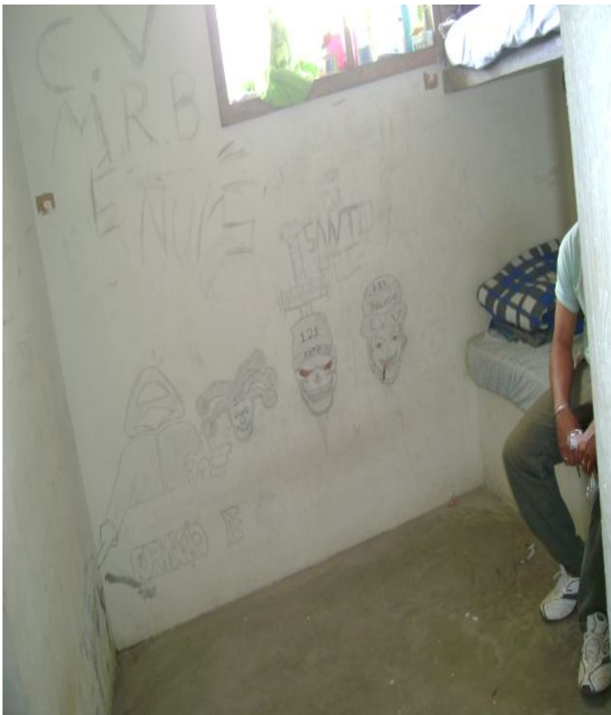
Legenda: Ilustrações feitas pelos adolescentes nas paredes do alojamento. Detalhe para os desenhos relacionados a figuras macabras e inscrição dos artigos 121 e 157 do Código Penal.