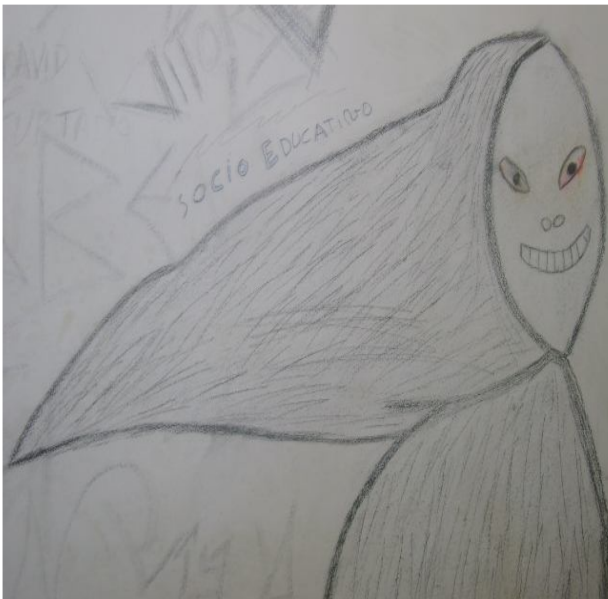
Legenda: Ilustrações feitas pelos adolescentes nas paredes do alojamento associando a figura da morte ao sistema Sócio-Educativo.