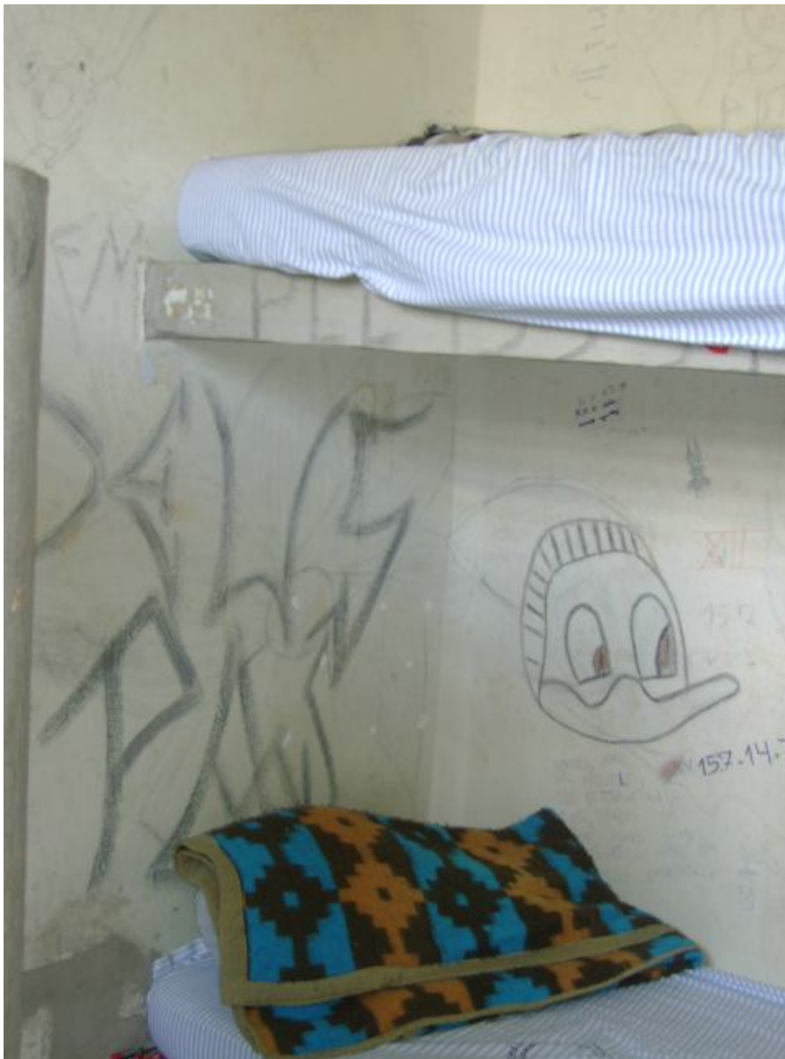
Legenda: Ilustrações feitas pelos adolescentes nas paredes do alojamento indicando tipificações penais.