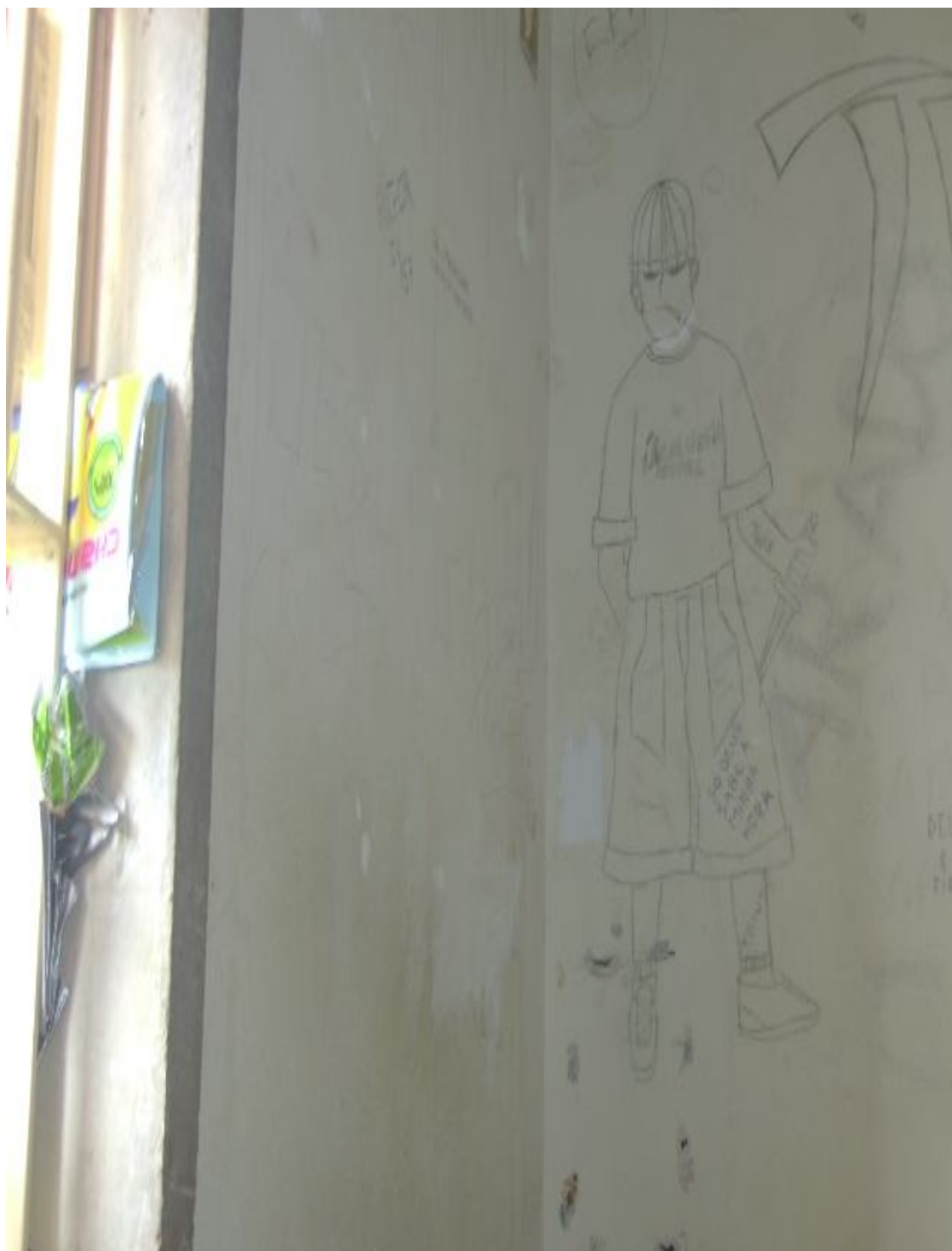
Legenda: Ilustrações feitas pelos adolescentes nas paredes dos alojamentos associadas a cenas violentas.