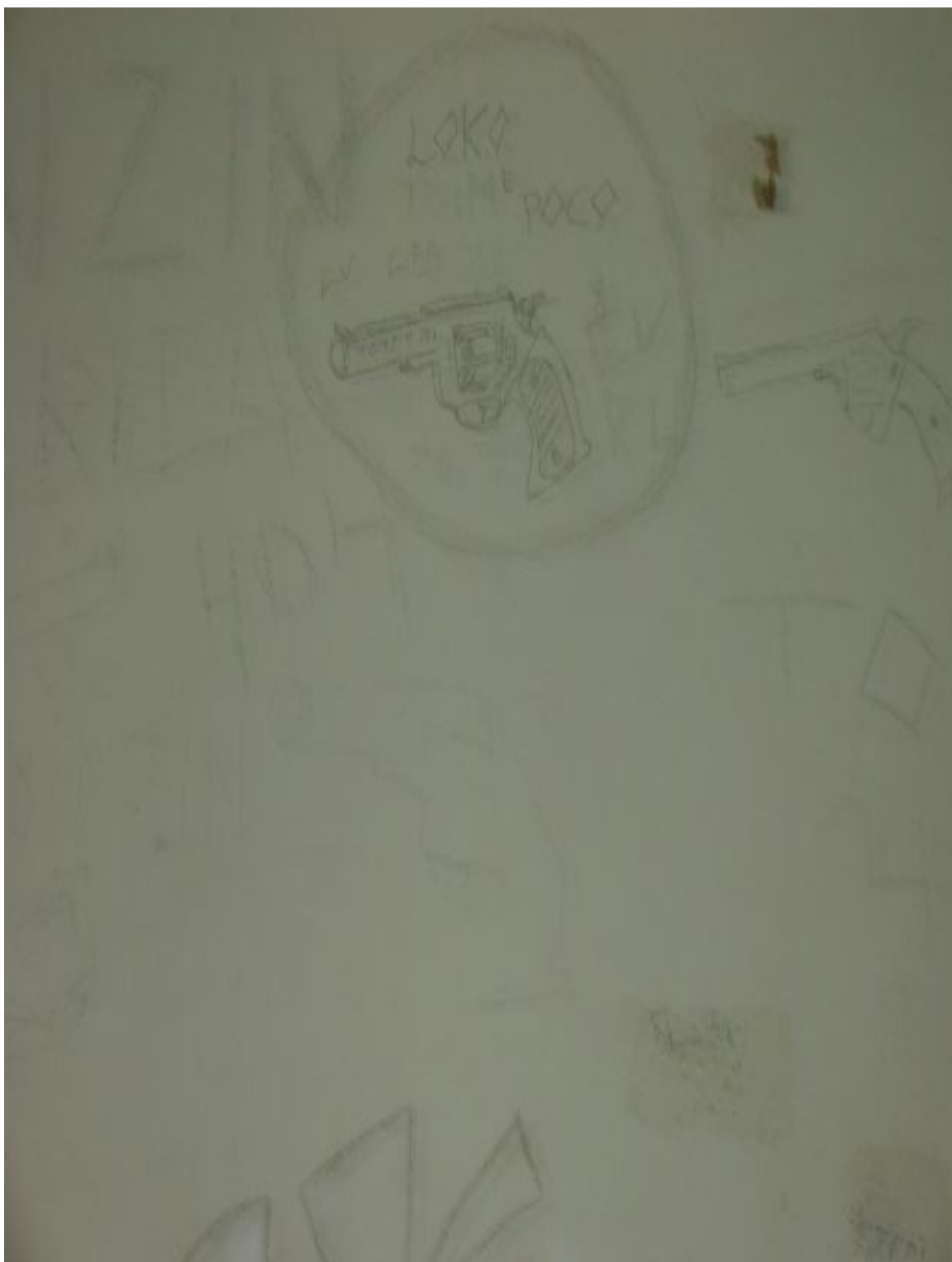
Legenda: Ilustrações feitas pelos adolescentes nas paredes do alojamento.