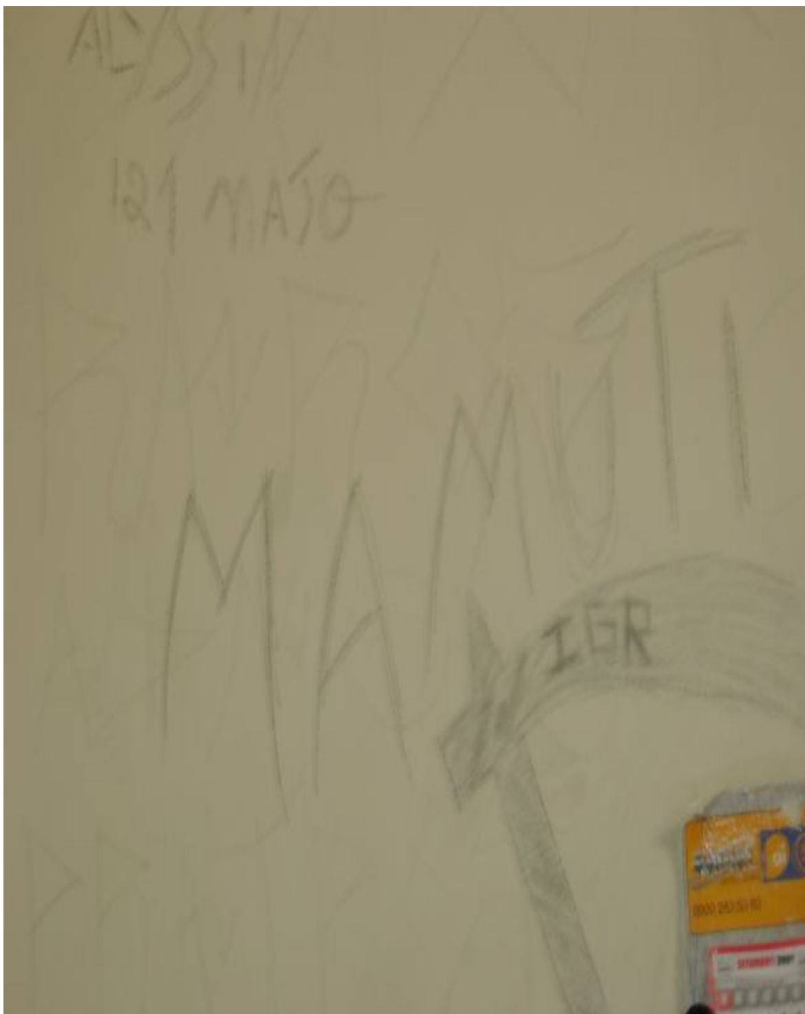
Legenda: Ilustrações feitas pelos adolescentes nas paredes do alojamento. Detalhe da foice e acima a inscrição do art. 121 do Código Penal.