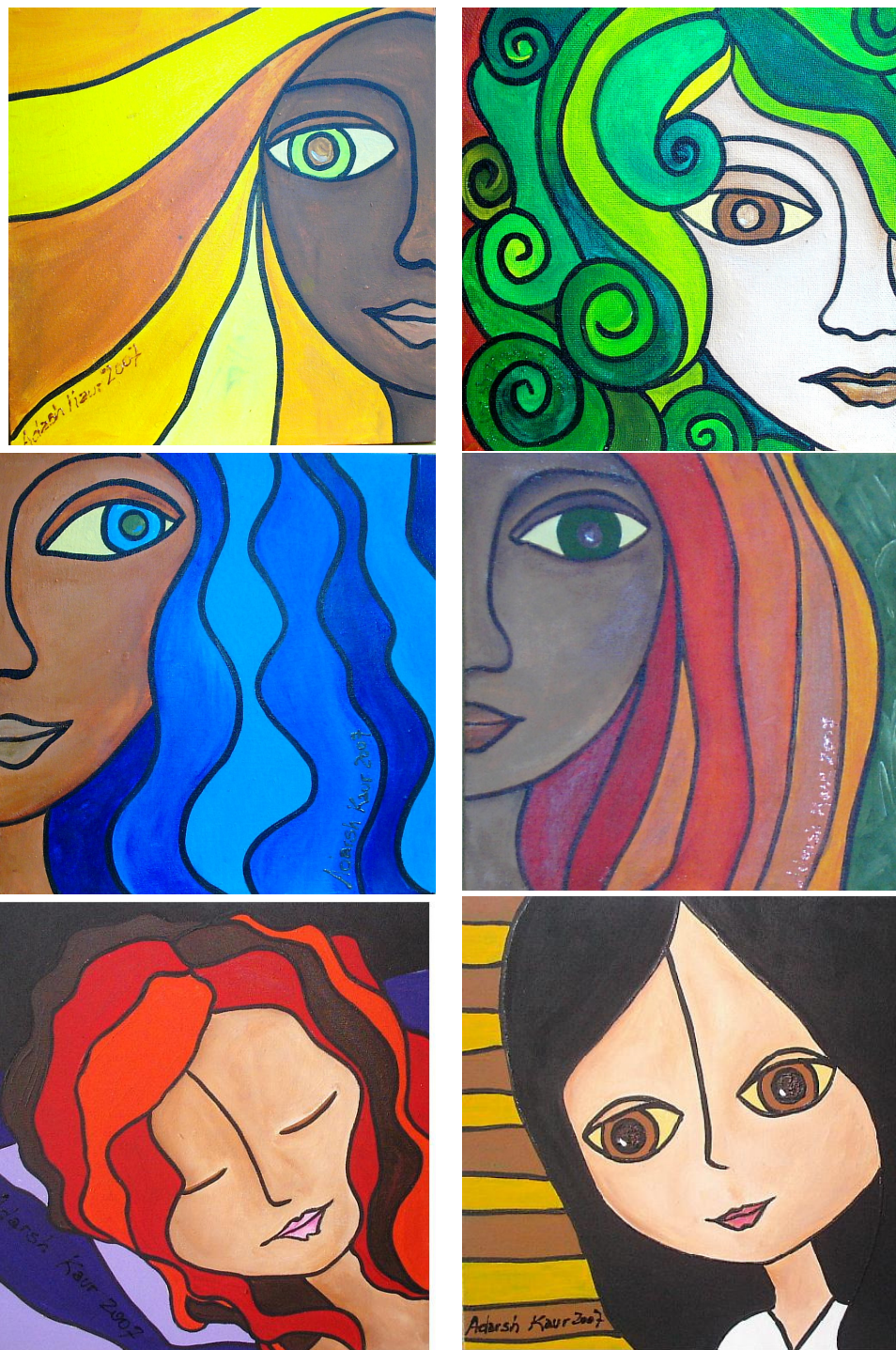
Rostro 1, Rostro 2, Rostro 4, Negra, Niña durmiendo e Niña pelonegro – Adarsh Kaur (2008)