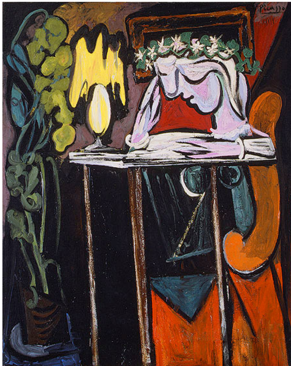
Girl reading at a table – Pablo Picasso (2008)