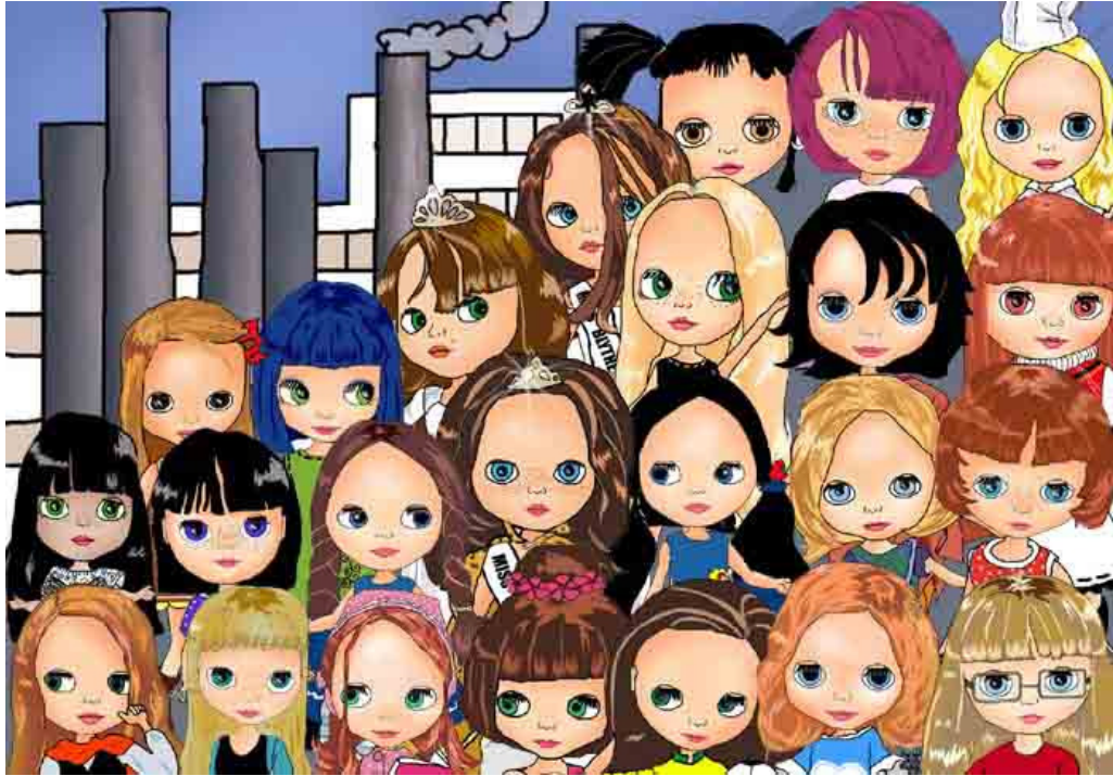
Criação livre em homenagem a Tarsila do Amaral – Autor desconhecido (2008)