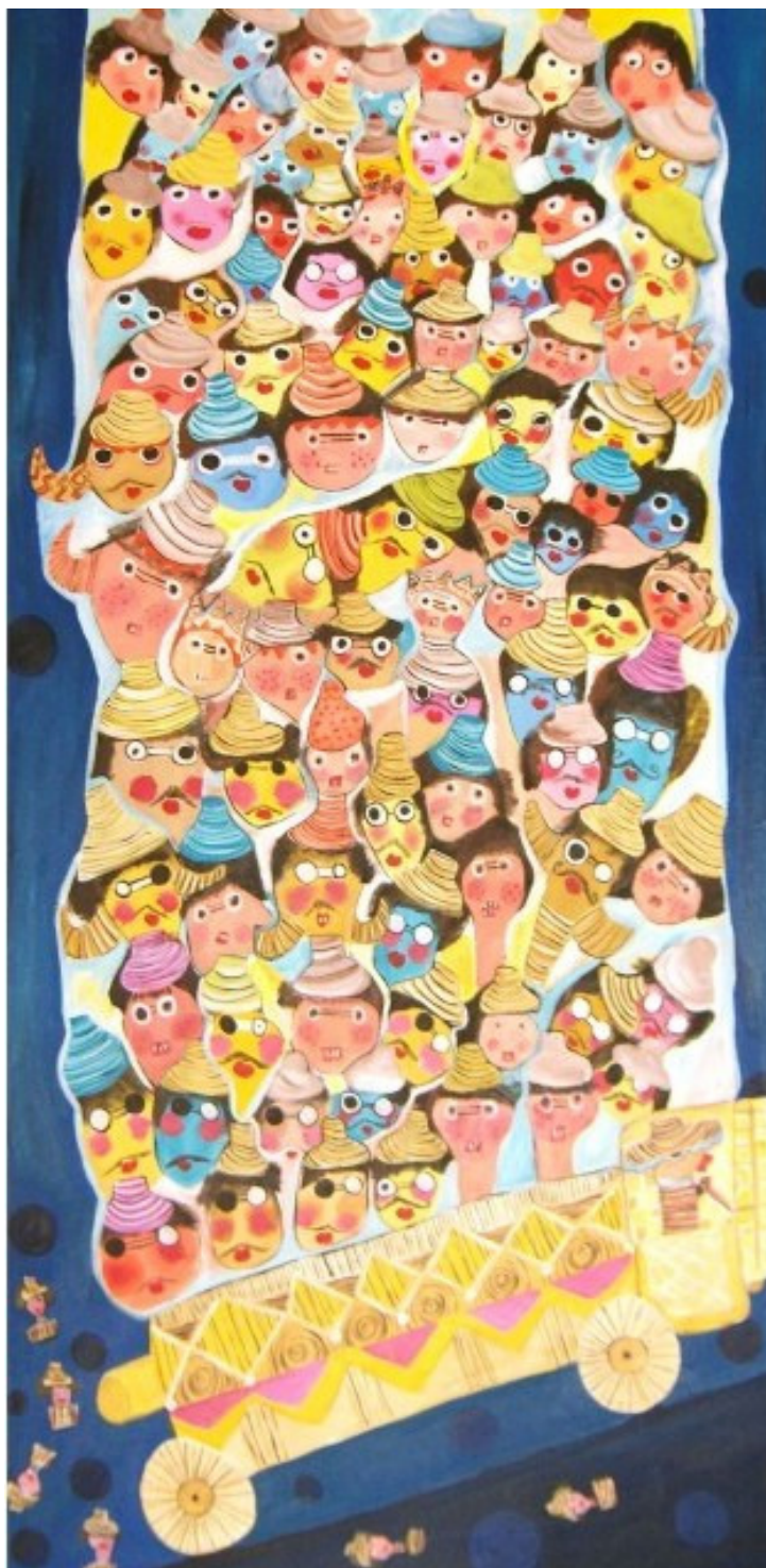
Caminhão bombado de gente – Gilda Lacerda (2008b)