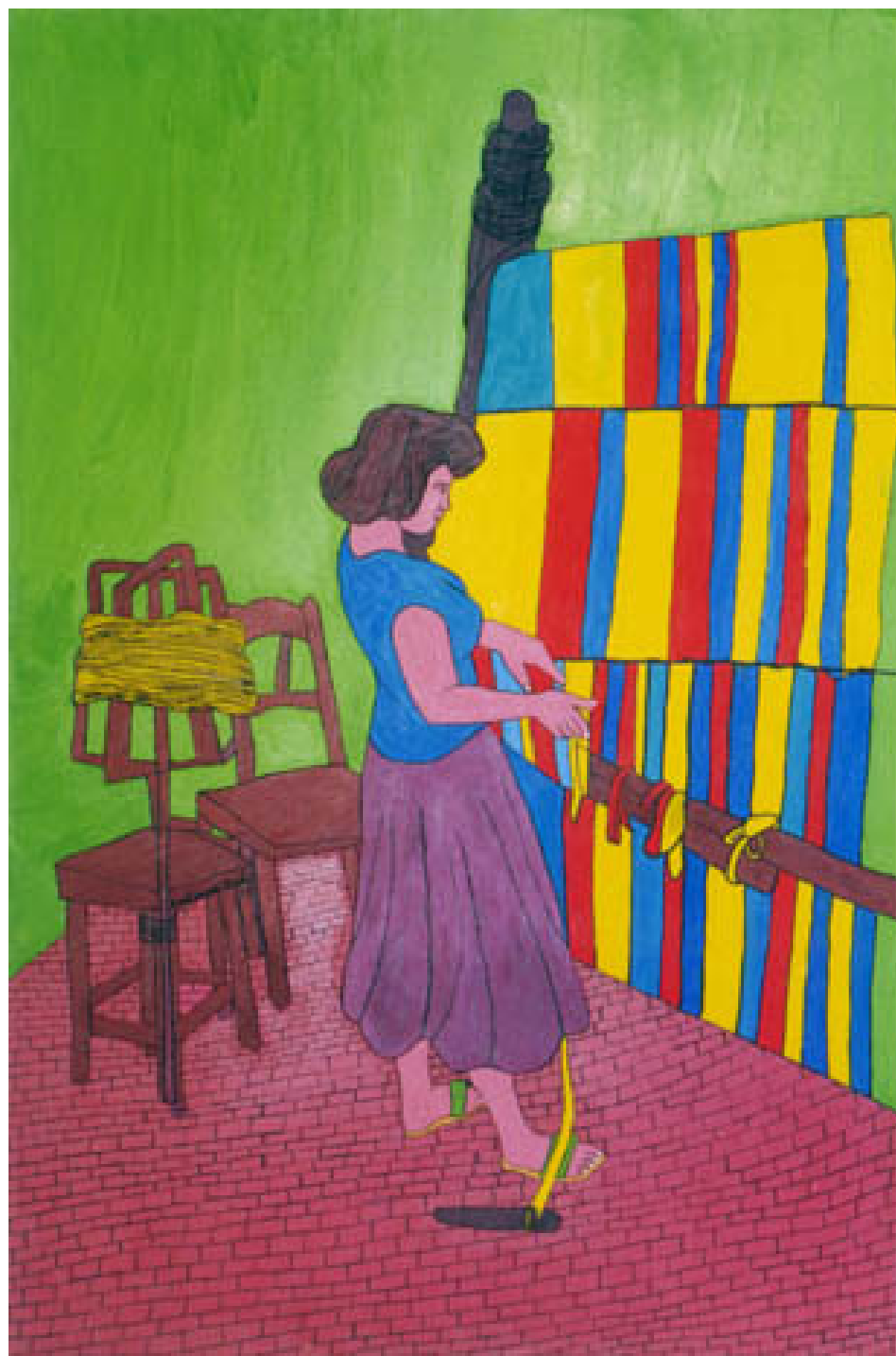
Tecedora – Dulcinéa Brito (2008)