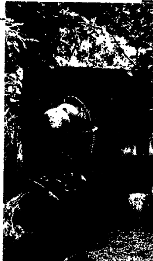
Cesta tradicional de piqueique, que contém o Bife à Milanesa e o Lanche Paulista.

Bife à milanesa é delicioso frito, quando bem frito e escorrido. Ovos cozidos são frescos e gostos e econômicos. Um bom arroz de frango pode dar um grande toque final. E até um bom "Lanche Paulista" (hambúrguer, batata frita e Coca-Cola) do McDonald's pode ser uma excelente opção e barata (Café $7,00).