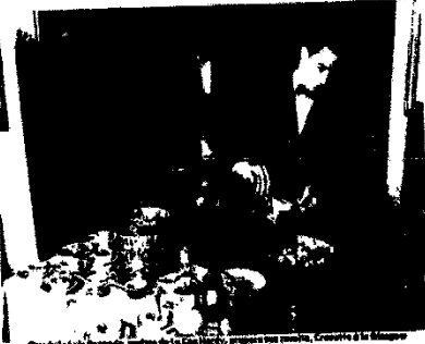
Condição ideal: flambado, método de The Joy of Cooking, prepara-se assim, Crêpe e à la Glasgow