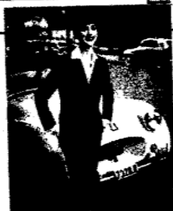
Vesta de uma mulher de longa tradição em "belle époque".

E bem achar pedaços de jornais antigos do lado de um livro ou entre o pão-de-sal e o queijo de crocância de um café de um hotel. As vezes, aparecem na parte interna de um porta-retratos desmontado.