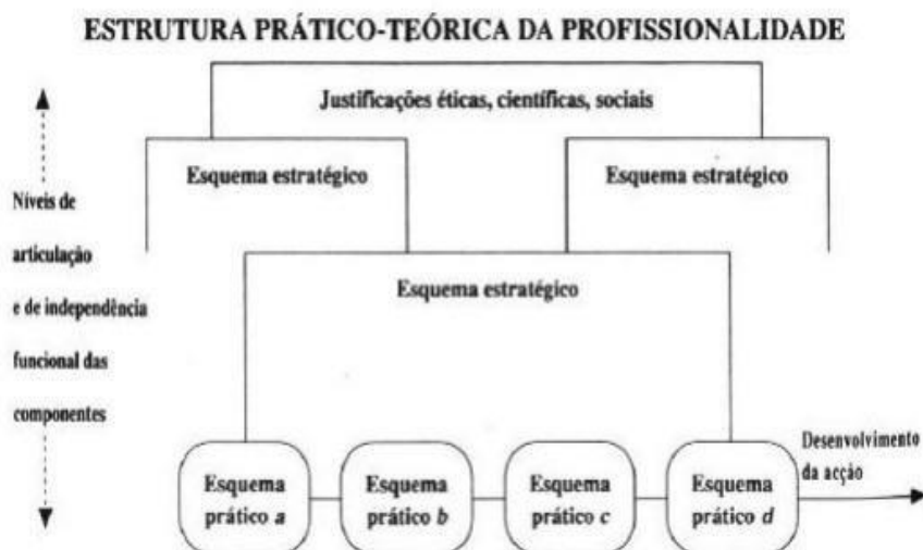
FIGURA 2. Modelo de Praxis Docente (SACRISTÁN, 1995, p.82)

Nesse aspecto, a flexibilidade da prática e a capacidade de adaptação dos professores, assim como a reflexão sobre as suas rotinas práticas permite que tais esquemas sejam justapostos, mesclados, alterados e modificados, ou seja, sejam adaptados de forma consciente à realidade escolar específica. Tal feito é possível porque subjaz ao esquema prático os esquemas estratégicos, compreendidos como “um princípio regulador a nível intelectual e prático, isto é, uma ordem consciente na acção, (...) vão além das situações concretas, implicando um saber como, completado por um saber porquê (SACRISTÁN, 1995, p. 8-81:). A figura abaixo ajuda-nos a compreender melhor a ideia do autor: