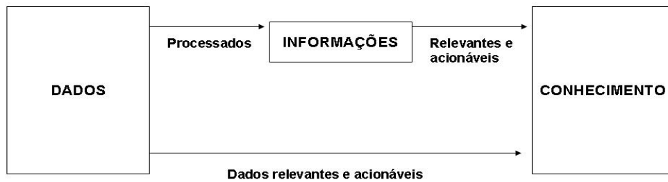
Figura 1: Dados, informações e conhecimento

A Figura 1 mostra a relação existente entre dado, informação e conhecimento.