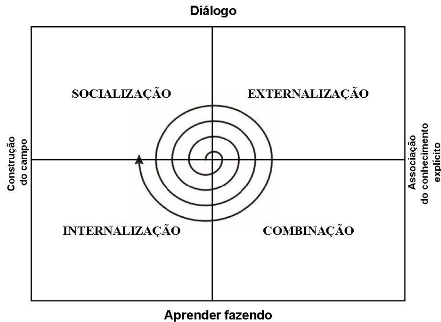
Figura 3: Espiral do conhecimento