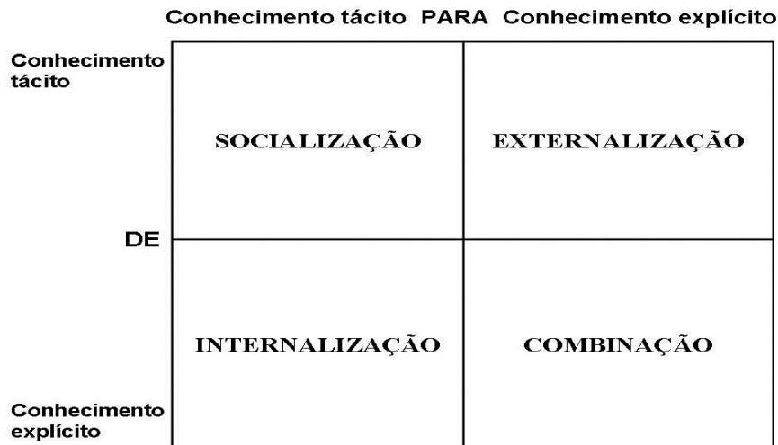
Figura 2: Os quatro modos de conversão do conhecimento

A Figura 2 mostra as quatro formas de conversão do conhecimento, sendo que cada forma será explicitada posteriormente.