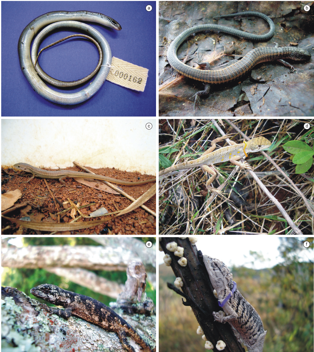
Figura 1. Espécies de lagartos registradas na Reserva Biológica Unilavras – Boqueirão, no município de Ingai, Estado de Minas Gerais, Brasil. a) Ophiodes striatus ; b) Heterodactylus imbricatus ; c) Cercosaura ocellata ; d) Enyalius bilineatus ; e) Urostrophus vaultieri ; f) Polychrus acutirostris .

espécies registradas, T. itambere estava frequentemente associado a lugares com afloramentos rochosos, confirmando a observação de Rodrigues (1987) e de Colli et al. (2002), de que esta espécie é típica de áreas abertas de Cerrado. O mesmo padrão também foi observado por Ávila Pires (1995) e Sousa et al. (2010) para C. ocellata , que pode habitar formações savânicas e áreas marginais nas formações