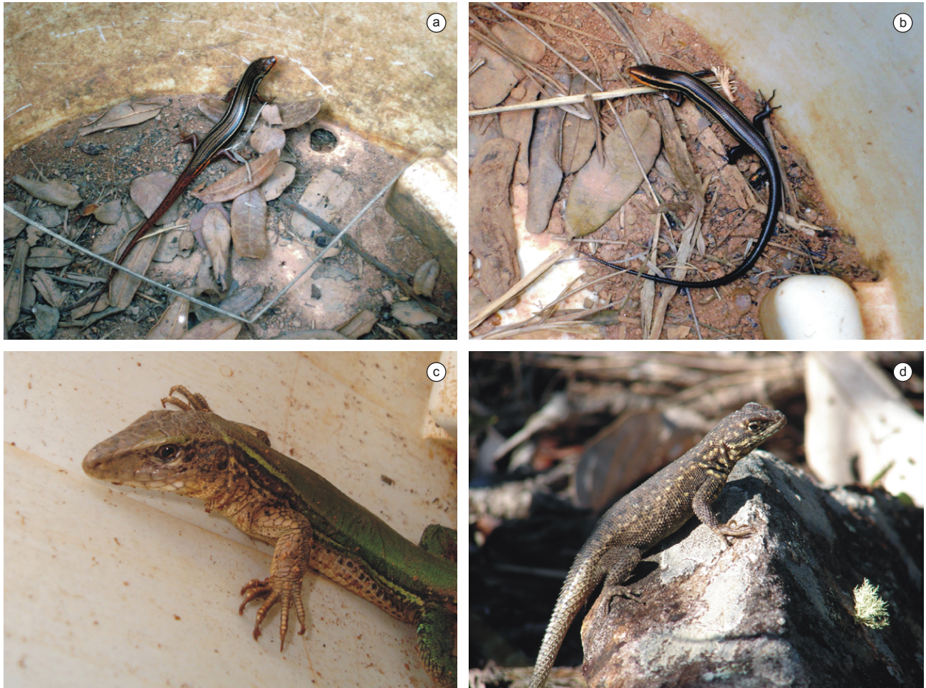
Figura 2. Espécies de lagartos registradas na Reserva Biológica Unilavras – Boqueirão, no município de Ingaí, Estado de Minas Gerais, Brasil. a) Mabuya dorsivittata ; b) Mabuya dorsivittata ; c) Ameiva ameiva ; d) Tropidurus itambere .