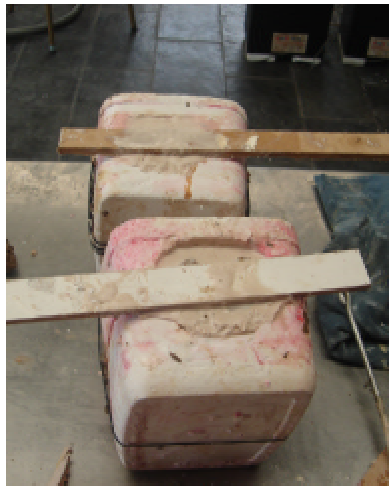
Figura 5 – Boneco de argila em processo de confecção da fôrma de silicone