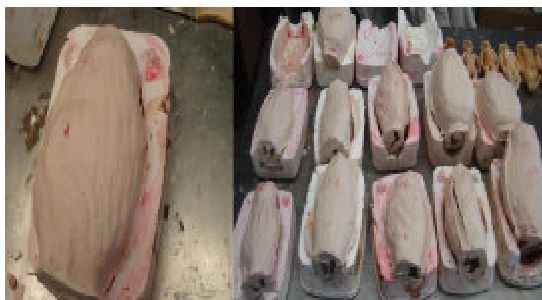
Figura 6 – Fôrmas de gesso e fôrmas de silicone