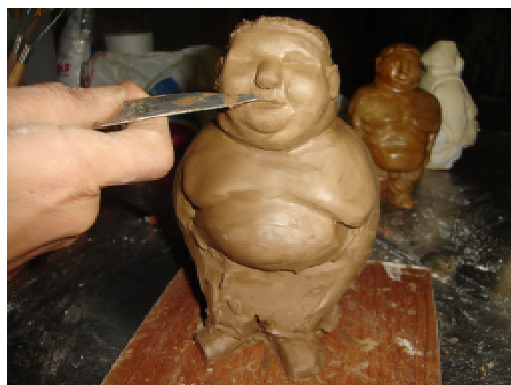
Figura 2 – Boneco de argila criado a partir da figura 9 da Escala de Stunkard