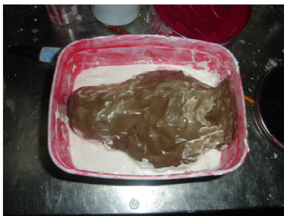
Figura 3 – Boneco de argila em processo de confecção da fôrma de gesso