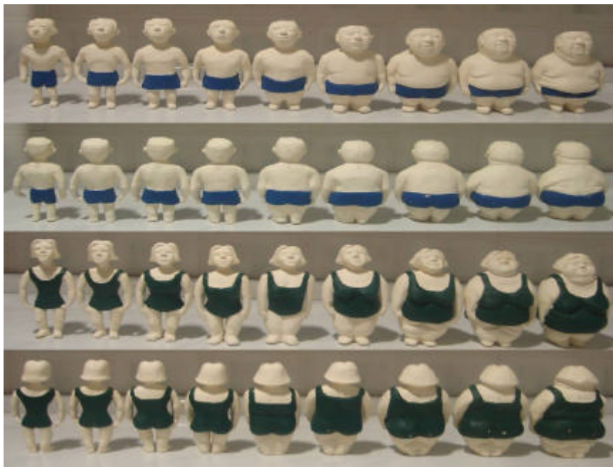
Figura 7 - Escala de Silhuetas Tridimensionais (EST)