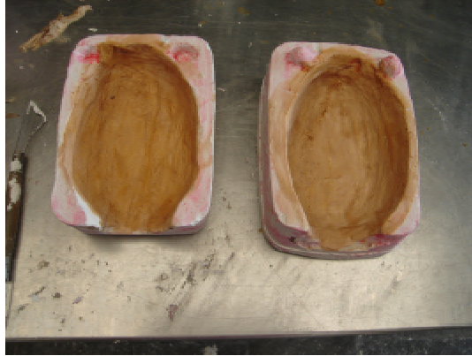
Figura 4 – Fôrma de gesso aberta em duas metades