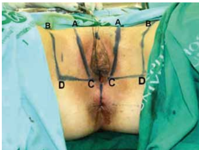
Figura 2 - Marcação dos retalhos medindo 12x6 cm. Base situada a nível posterior do intróito vaginal e ápice próximo ao triângulo femoral, metade situado na vulva e metade na raiz de coxa. Linha DC: base do retalho; Linha AB: extremidade do retalho.