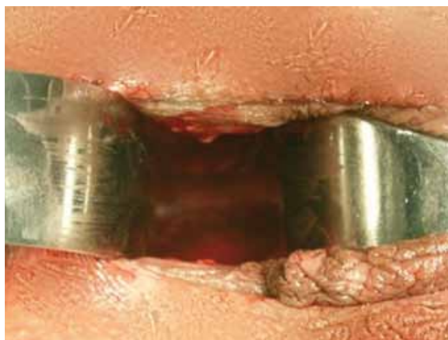
Figura 4 - Formação do neotúnel.

área doadora, com pouco descolamento e discreta tensão. A base dos retalhos situa-se posteriormente, localizando-se à altura do intróito vaginal (Figura 2 – linha DC) e a extremidade dos retalhos é anterior, à altura do triângulo femoral (Figura 2-linha AB);