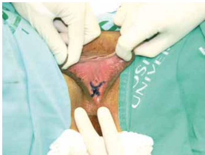
Figura 3 - Marcação em duplo Y no intróito vaginal.