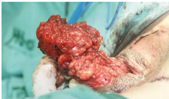
Figura 7 - Fundo de saco é ancorado no final da cavidade dissecada para prevenção de prolapso.