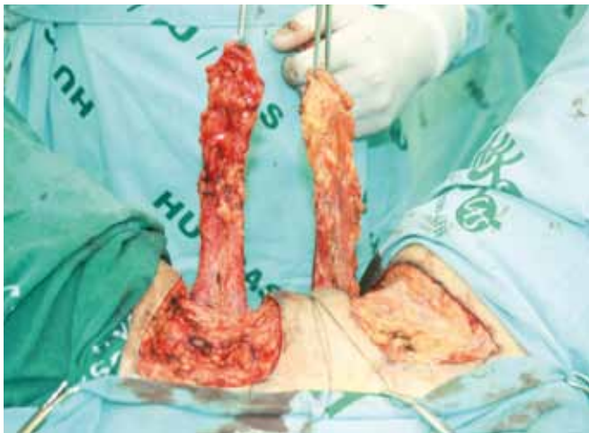
Figura 5 - Retalhos já iniciados mostrando a fáscia profunda dos músculos adutores.

O acompanhamento pós-operatório variou entre 6 meses e 3 anos, não sendo observadas alterações significativas na