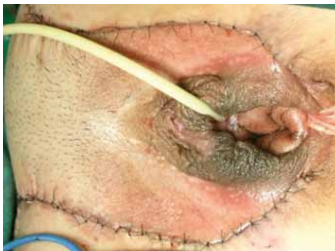
Figura 8 - Área doadora totalmente fechada por sutura em 2 planos.