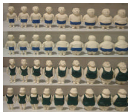
Figura 2: Escala de Silhuetas Tridimensionais