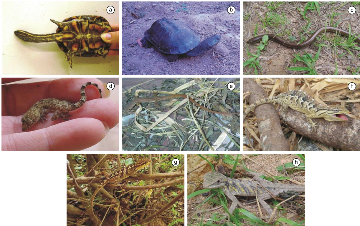
Figura 5. Algumas espécies de répteis registradas em fragmentos de Cerrado e Mata Atlântica do Campo das Vertentes, Estado de Minas Gerais, Sudeste do Brasil. a) Hydromedusa tectifera ; b) Acanthochelys radiolata ; c) Ophiodes striatus ; d) Hemidactylus mabouia ; e) Cercosaura ocellata ; f) Polychrus acutirostris ; g) Enyalius bilineatus fêmea; e h) Enyalius bilineatus macho.

As duas espécies de quelônios, o cágado-pescoço-de-cobra Hydromedusa tectifera (Figura 5a) e o cágado amarelo Acanthochelys radiolata (Figura 5b), foram encontradas nos ambientes aquáticos da área de estudo, em áreas de remanso e áreas brejosas, respectivamente, durante a busca ativa.