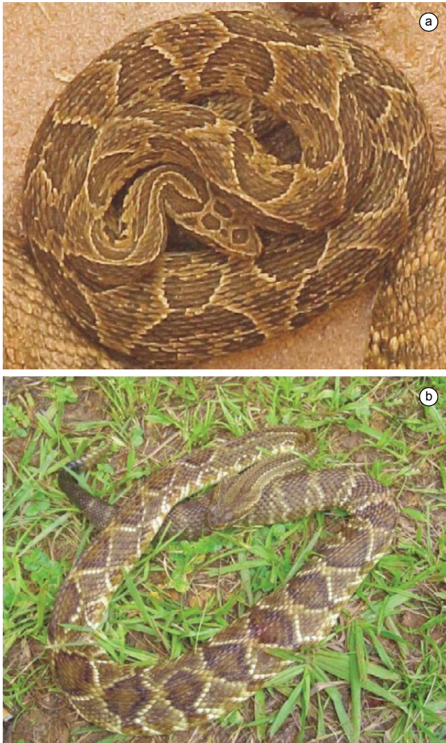
Figura 8. Algumas espécies de répteis registradas em fragmentos de Cerrado e Mata Atlântica do Campo das Vertentes, Estado de Minas Gerais, Sudeste do Brasil. a) Bothropoides newwiedi ; e b) Caudisona durissa .

Figure 8. Some species of reptiles recorded in the fragments of Cerrado and Atlantic Forest at the Campo das Vertentes, Minas Gerais State, Southeastern Brazil. a) Bothropoides newwiedi ; and b) Caudisona durissa .