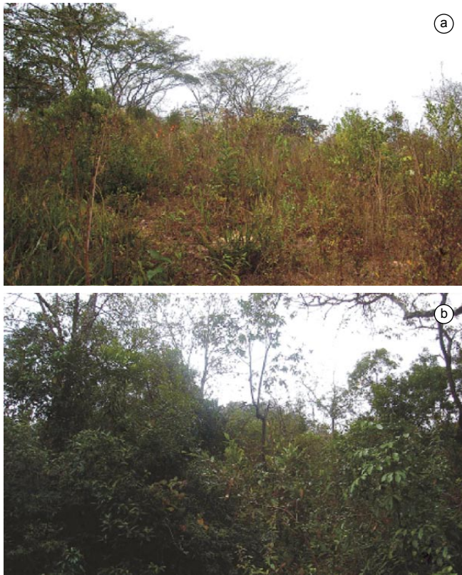
Figura 2. Áreas onde foram instaladas as armadilhas de interceptação e queda com uso de cerca guia; a) campo cerrado, b) borda da mata de galeria.

As armadilhas ficaram abertas durante quatro dias por mês, sendo vistoriadas no terceiro e no quarto dia. As inspeções foram sempre realizadas por, no mínimo, três pessoas. Caixas de plástico rígido com fechamento por trava foram utilizadas para o devido acondicionamento e transporte dos animais coletados a serem identificados.