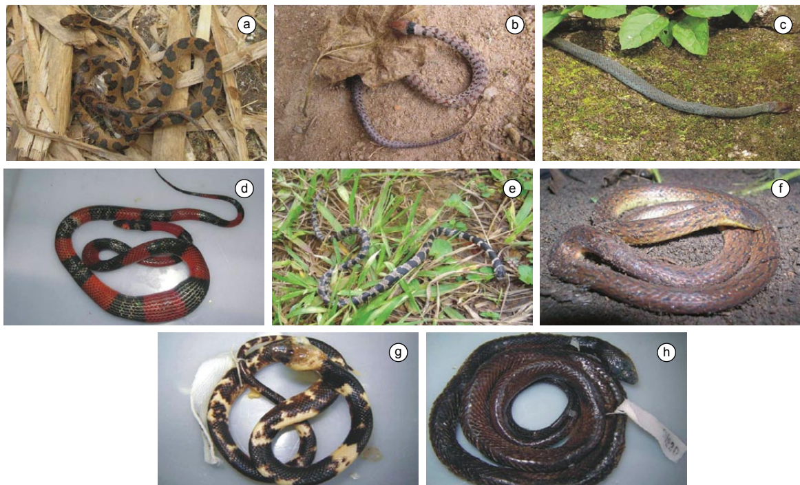
Figura 7. Algumas espécies de répteis registradas em fragmentos de Cerrado e Mata Atlântica do Campo das Vertentes, Estado de Minas Gerais, Sudeste do Brasil. a) Leptodeira annulata ; b) Liophis poecilogyrus ; c) Liophis typhlus ; d) Oxyrhopus guibei ; e) Sibynomorphus mikanii ; f) Atractus pantostictus ; g) Pseudoboa nigra ; e h) Pseudoboa serrana .

Figure 6. Some species of reptiles recorded in the fragments of Cerrado and Atlantic Forest at the Campo das Vertentes, Minas Gerail State, Southeastern Brazil. a) Mabuya frenata ; b) Ameiva ameiva ; c) Tupinambis merianae ; d) Tropidurus itambere ; e) Amphisbaena dubia ; f) Amphisbaena microcephala ; g) Epicrates crassus ; and h) Apostolepis assimilis .