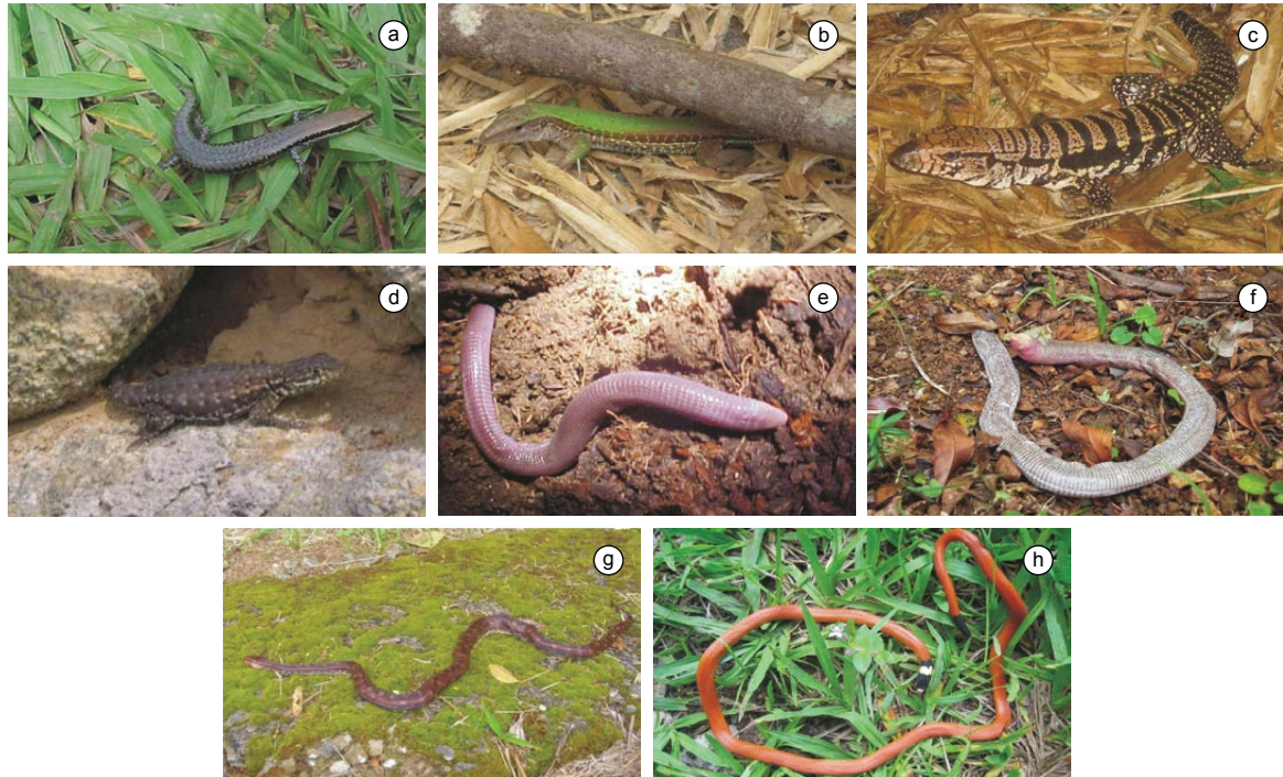
Figura 6. Algumas espécies de répteis registradas em fragmentos de Cerrado e Mata Atlântica do Campo das Vertentes, Estado de Minas Gerais, Sudeste do Brasil. a) Mabuya frenata ; b) Ameiva ameiva ; c) Tupinambis merianae ; d) Tropidurus itambere ; e) Amphisbaena dubia ; f) Amphisbaena microcephala ; g) Epicrates crassus ; e h) Apostolepis assimilis .

Figure 6. Some species of reptiles recorded in the fragments of Cerrado and Atlantic Forest at the Campo das Vertentes, Minas Gerail State, Southeastern Brazil. a) Mabuya frenata ; b) Ameiva ameiva ; c) Tupinambis merianae ; d) Tropidurus itambere ; e) Amphisbaena dubia ; f) Amphisbaena microcephala ; g) Epicrates crassus ; and h) Apostolepis assimilis .