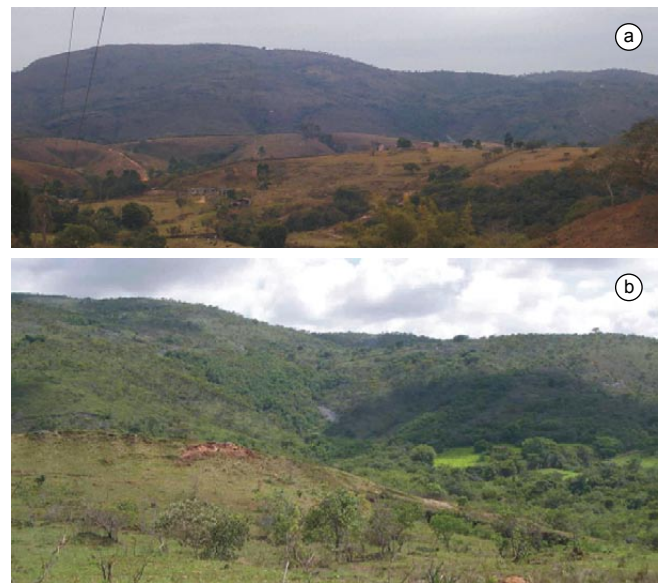
Figura 1. a) Vista da aérea urbana; b) fisionomia da área de estudo, localizada na Serra da Bandeira, no município de Ritápolis, Minas Gerais.

As armadilhas de interceptação e queda com uso de cerca guia foram instaladas em uma área de Cerrado e em uma mata de galeria da área de estudo, situada na área rural denominada Serra