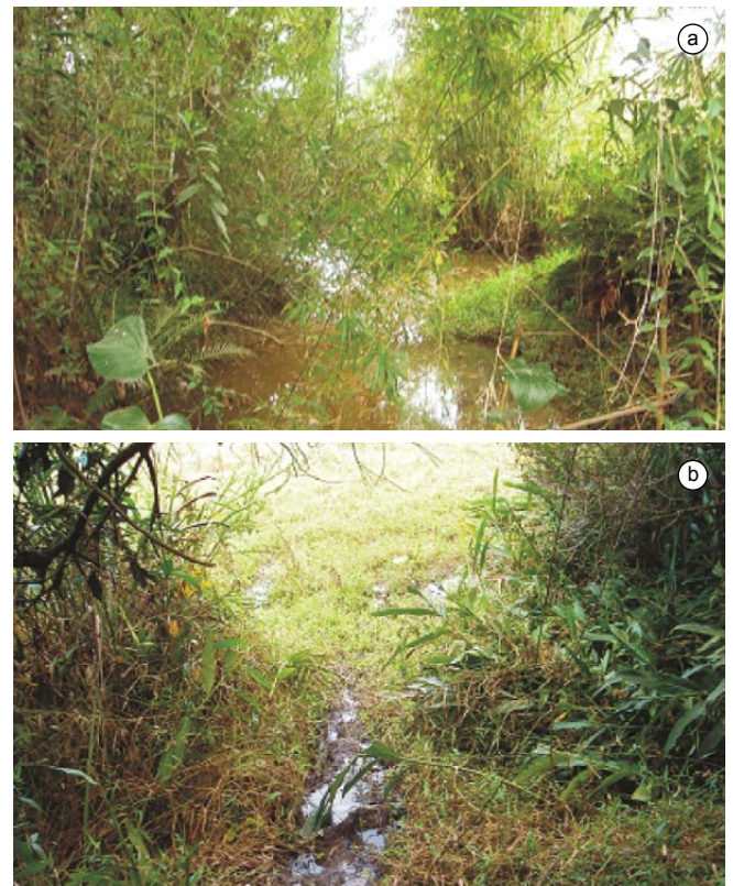
Figura 3. a-b) Ambientes aquáticos onde os espécimes de Testudines foram capturados.

Para verificar a qualidade dos dados coletados e avaliar o esforço de coleta foram construídas curvas de acumulação de espécies a partir da média de 1.000 aleatorizações dos dias de coleta com o programa EstimateS V. 8.2.0, através do estimador Jackknife 2 (Colwell 2006).