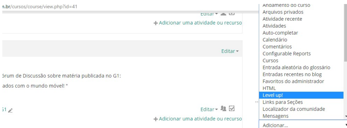
Figura II – Bloco de habilitação do Level Up