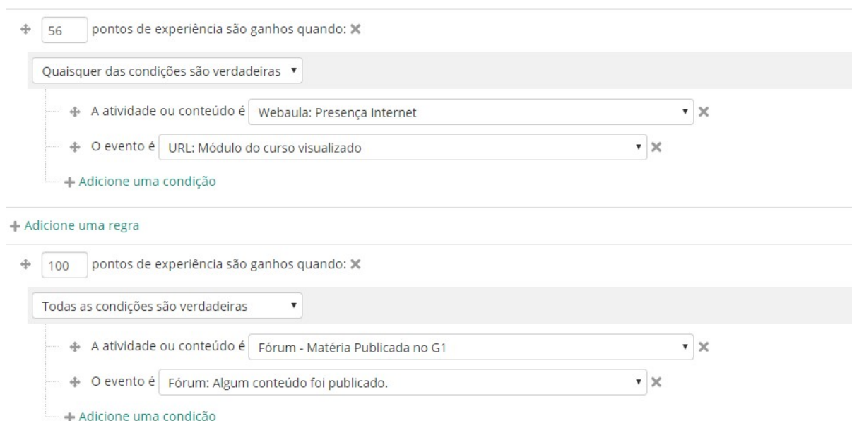
Figura III – Configuração da pontuação no Level Up