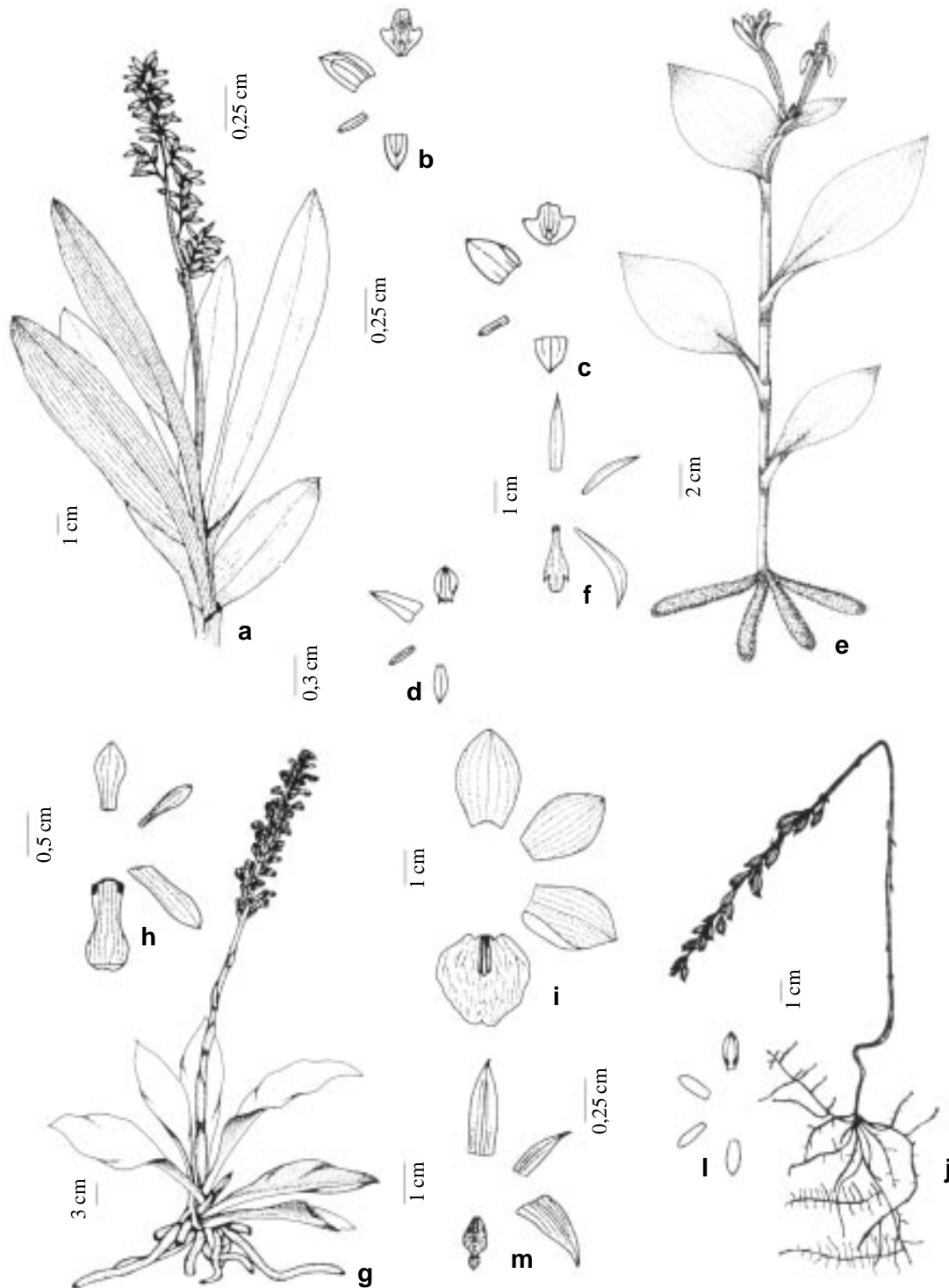
Figura 3. a-b. Polystachya concreta ; c. P. micrantha ; d. Prescottia stachyodes .; e-f. Psilochilus modestus ; g-h. Sauroglossum nitidum ; i. Warrea warreana ; j-l. Wulschlaegelia aphylla ; m. Xylobium variegatum .