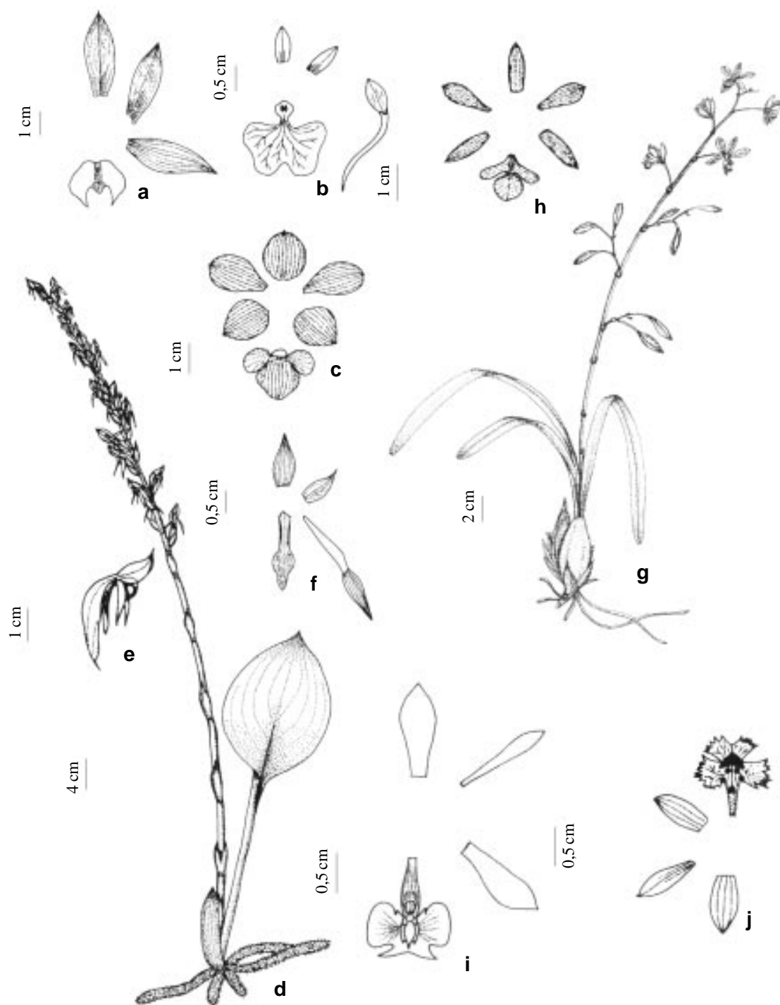
Figura 1. a. Catasetum cernuum ; b. Comparettia coccinea ; c. Cyrtopodium cardiochilum ; d-f Eltroplectris janeirensis ; g-h. Encyclia patens ; i. Epidendrum densiflorum ; j. E. secundum .